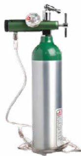
Tanque de oxígeno