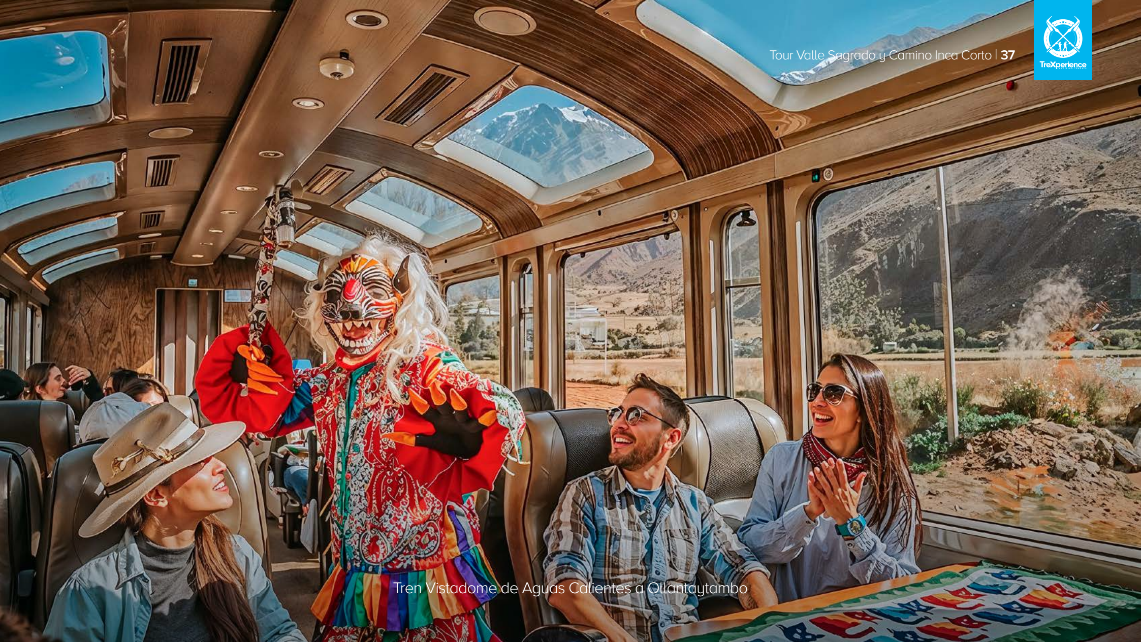
Tren Vistadome de Aguas Calientes a Ollantaytambo