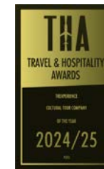
Travel & Hospitality Awards 2025