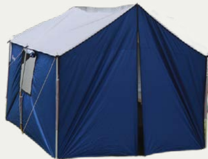
Carpas comedor privadas

Nuestro equipo de campamento está seleccionado pensando en tu comodidad y seguridad. Incluye carpas comedor, baños portátiles, sillas y mesas plegables, además de equipo de apoyo como tanques de oxígeno y teléfonos satelitales, según la ruta e itinerario.