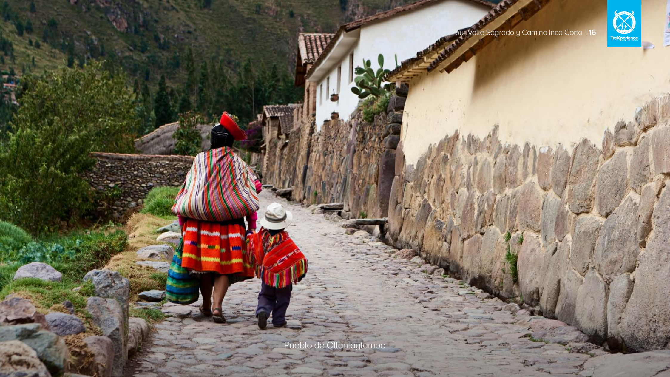
Pueblo de Ollantaytambo