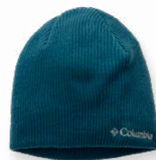
Gorro de Lana