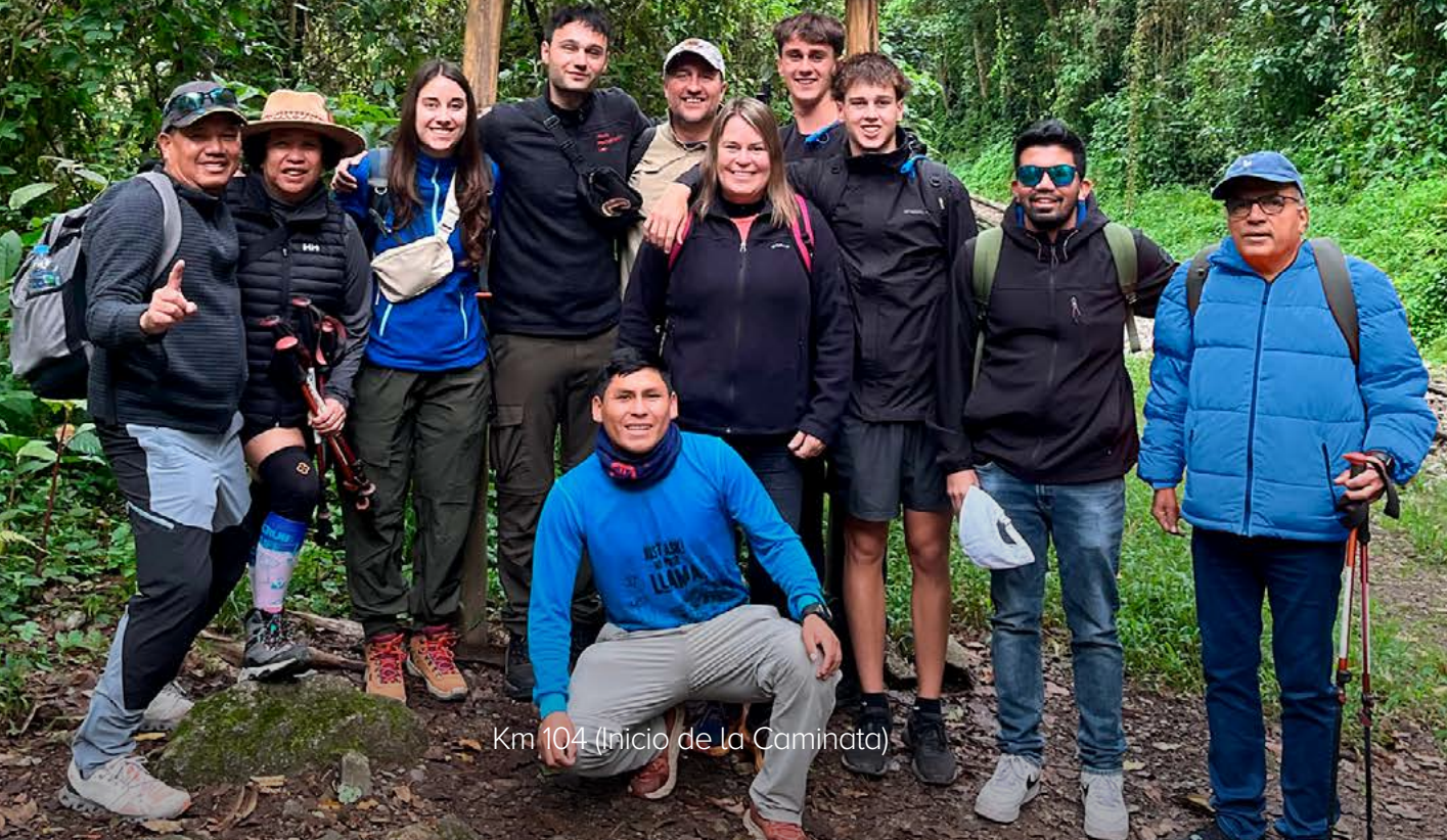
Km 104 (Inicio de la Caminata)