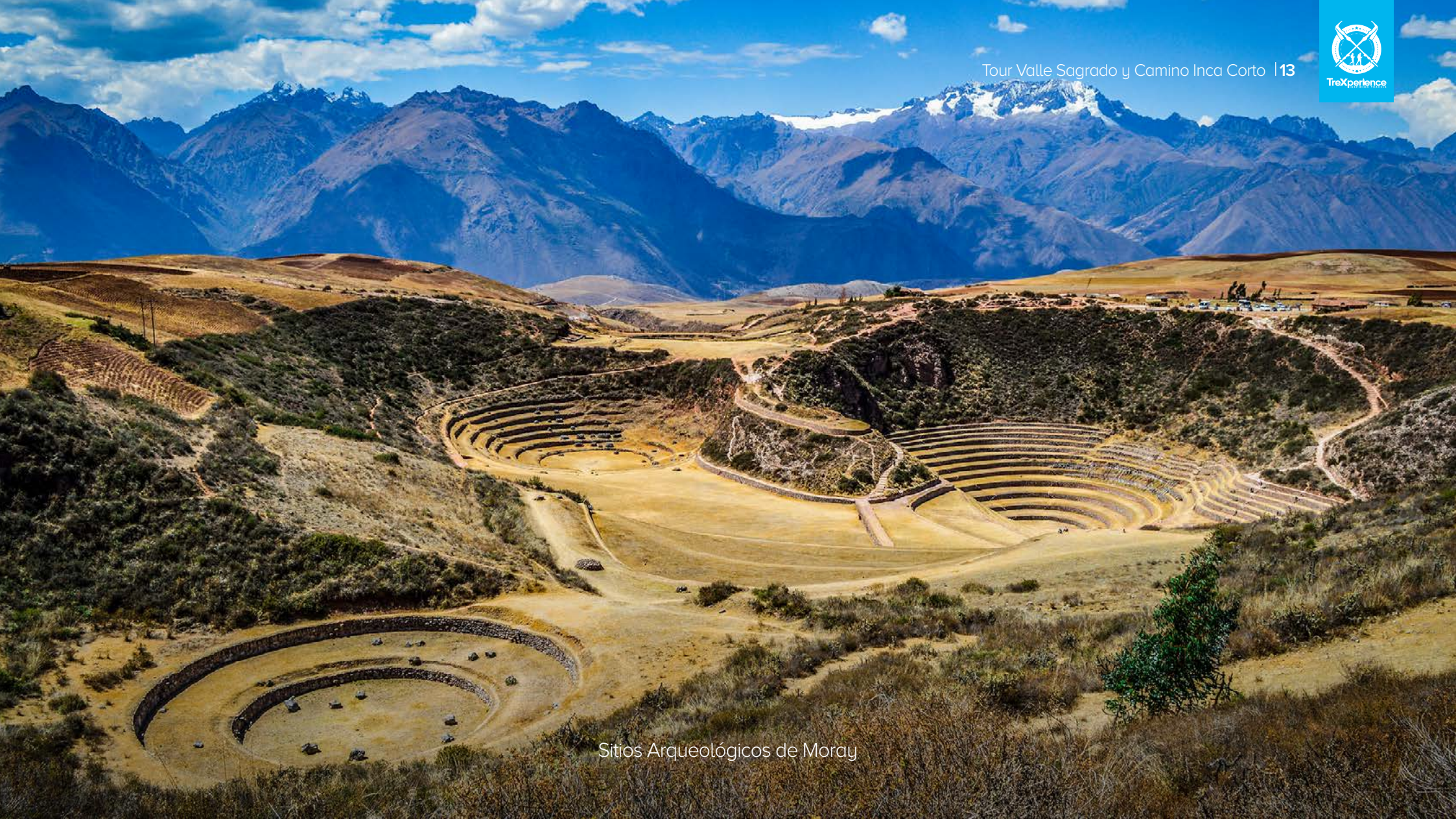
Sitios Arqueológicos de Moray