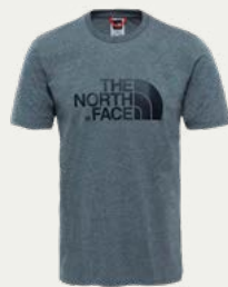
Camisetas de Secado Rápido