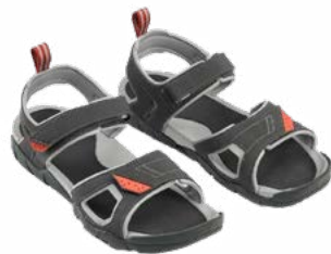
Calzado Ligero o Sandalias

Tu bolsa de lona llevará tu equipo principal y será transportada por nuestros porteadores durante la ruta. Empaca de forma ordenada, respetando el límite de peso indicado, y agrupa tus cosas por tipo. Así proteges tus pertenencias y te será más fácil encontrar lo que necesites en el campamento.