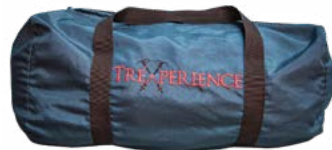
Duffel Bag 7kg / 15lb

Incluimos un polo de la agencia, un cobertor para mochila y un poncho de lluvia. Además, nuestros programas de senderismo incluyen una bolsa de lona de hasta 7 kg, transportada por nuestros porteadores. Consulta aquí si tu itinerario la incluye.