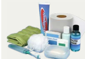
Articulos de higiene personal