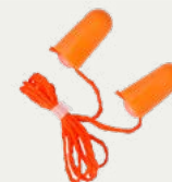
Tapones de oídos