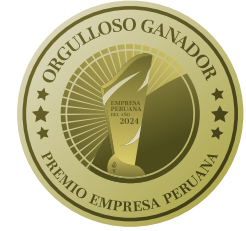
Empresa Peruana del año 2024