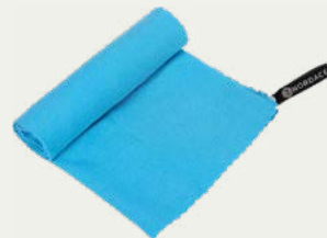
Toalla de Secado Rápido