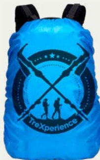
Cobertor de Mochila