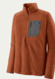
Polera de Polar