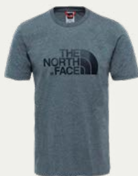
Camisetas de Secado Rápido

Los días de trekking pueden traer sol, viento, lluvia y cambios notables de temperatura. Por eso es importante vestirse en capas y elegir ropa cómoda para caminar. La idea es poder adaptarte fácilmente a las condiciones del clima, manteniéndote seco y abrigado cuando sea necesario.