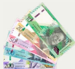
Dinero en efectivo (soles)