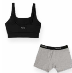
Ropa Interior Cómoda