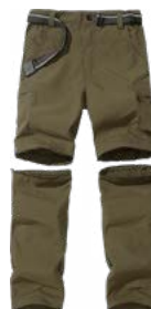
Pantalones de Caminata