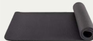
Colchoneta para dormir