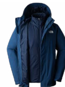
Casaca térmica e impermeable