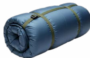
Bolsa de Dormir