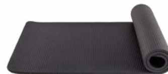
Colchoneta de Espuma