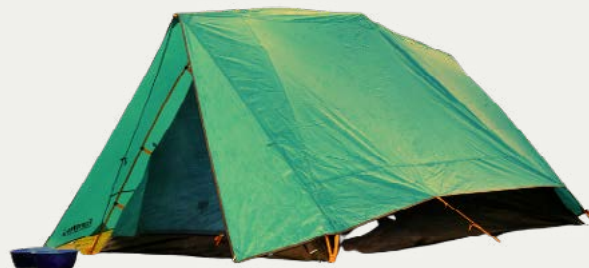
Carpas privadas de descanso

Nuestro equipo de campamento está seleccionado pensando en tu comodidad y seguridad. Incluye carpas para dormir, carpas comedor y baños portátiles, además de equipo de apoyo como tanques de oxígeno y teléfonos satelitales, según la ruta y el itinerario.