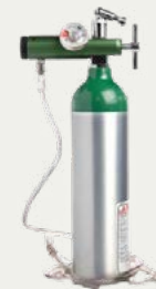
Tanques de Oxígeno