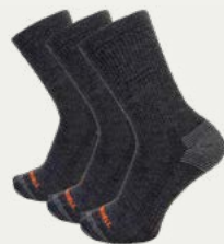
Calcetines de Caminata