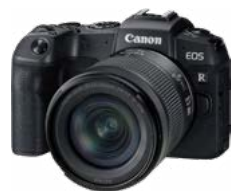
Camera y baterías extra