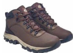
Botas de Caminata