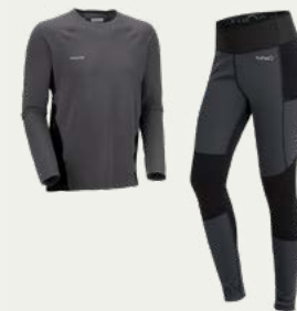
Capas de Ropa Térmica

Los días de trekking pueden traer sol, viento, lluvia y cambios notables de temperatura. Por eso es importante vestirse en capas y elegir ropa cómoda para caminar. La idea es poder adaptarte fácilmente a las condiciones del clima, manteniéndote seco y abrigado cuando sea necesario.