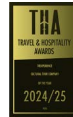
Travel & Hospitality Awards 2025