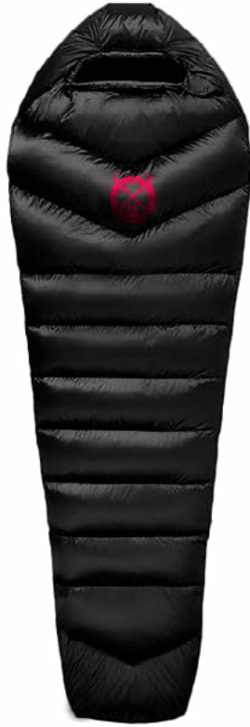
Bolsa de Dormir

Ofrecemos equipo de alquiler para que tu experiencia de caminata sea más cómoda, incluyendo bolsa de dormir, colchoneta inflable y bastones de trekking. Puedes agregar estos artículos según tus necesidades para descansar mejor y realizar una caminata mejor preparada.