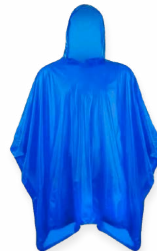
Poncho de Lluvia