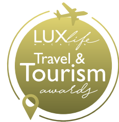
Premios LuxLife 2025