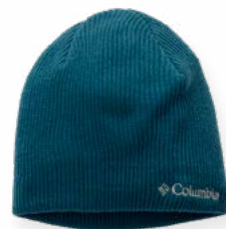
Gorro de Lana