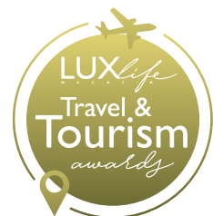
Premios LuxLife 2025