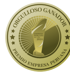
Empresa Peruana del año 2024