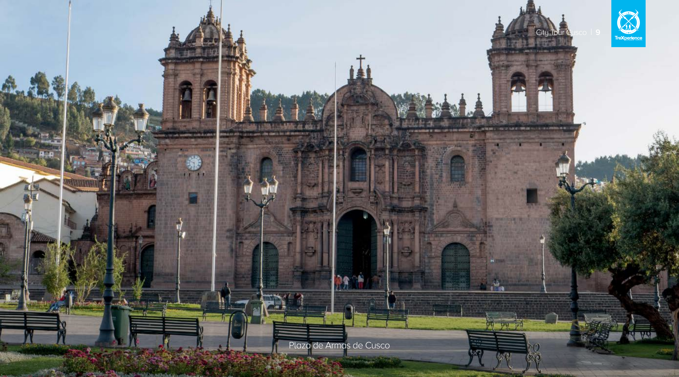
Plaza de Armas de Cusco