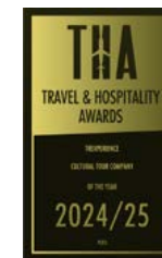
Travel & Hospitality Awards 2025