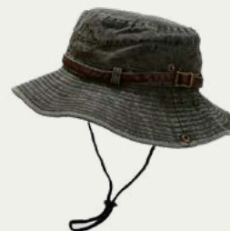
Sombrero para el sol