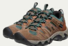
Zapatos de Caminata