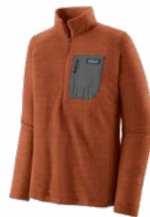
Casaca de Polar