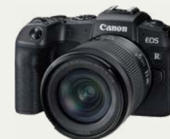
Camera y baterías extra