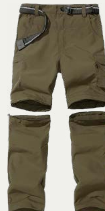
Pantalones para caminata