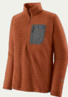
Casaca de polar