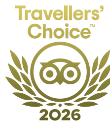
Best of the Best Tripadvisor 2022 a 2026