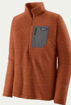
Casaca de polar