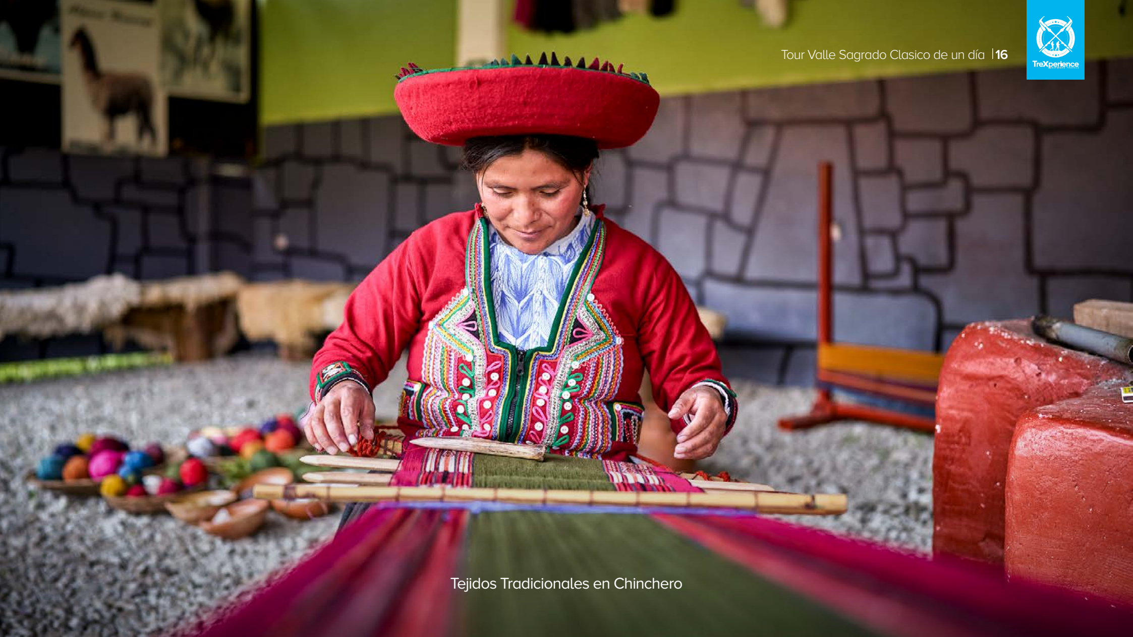
Tejidos Tradicionales en Chinchero