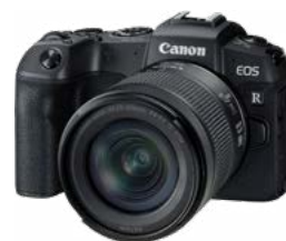
Camera y baterías adicionales