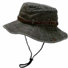
Sombrero con protección de cuello