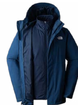
Casaca cortaviento impermeable