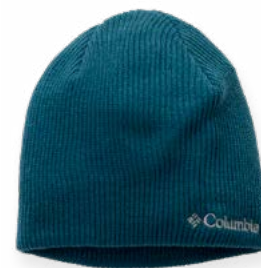
Gorro de lana