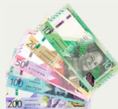
Dinero peruano en efectivo