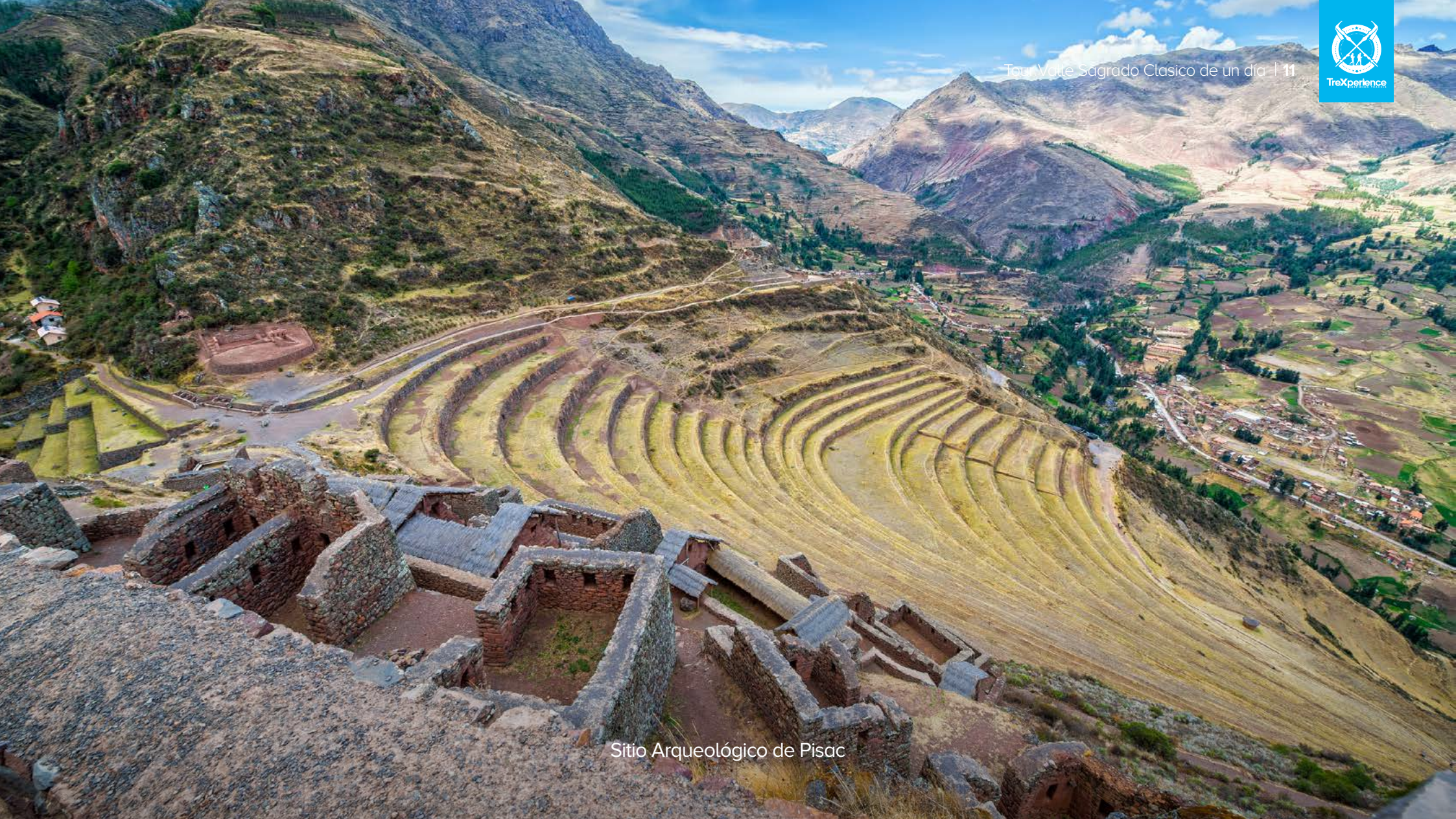
Sitio Arqueológico de Pisac