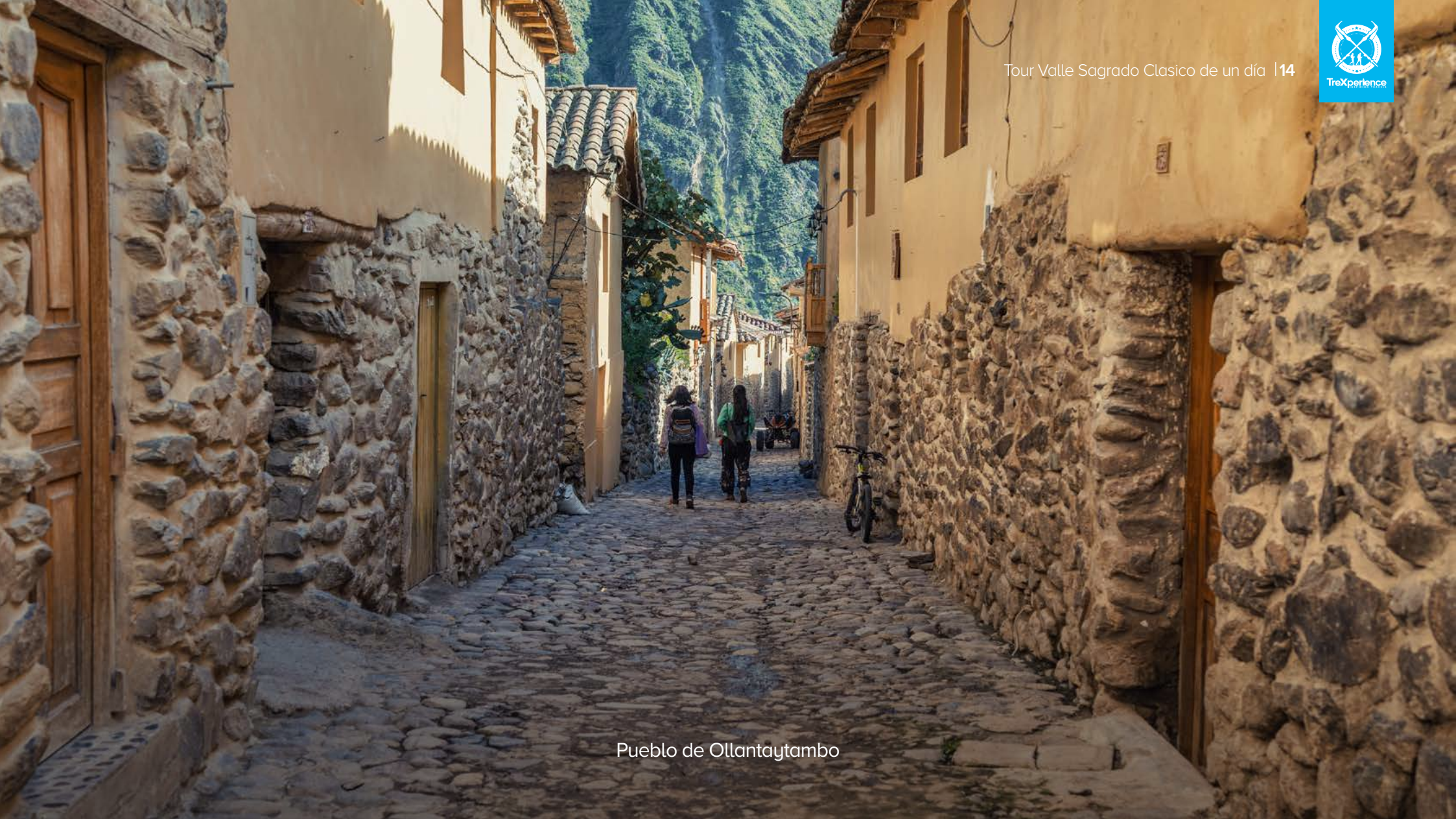
Pueblo de Ollantaytambo