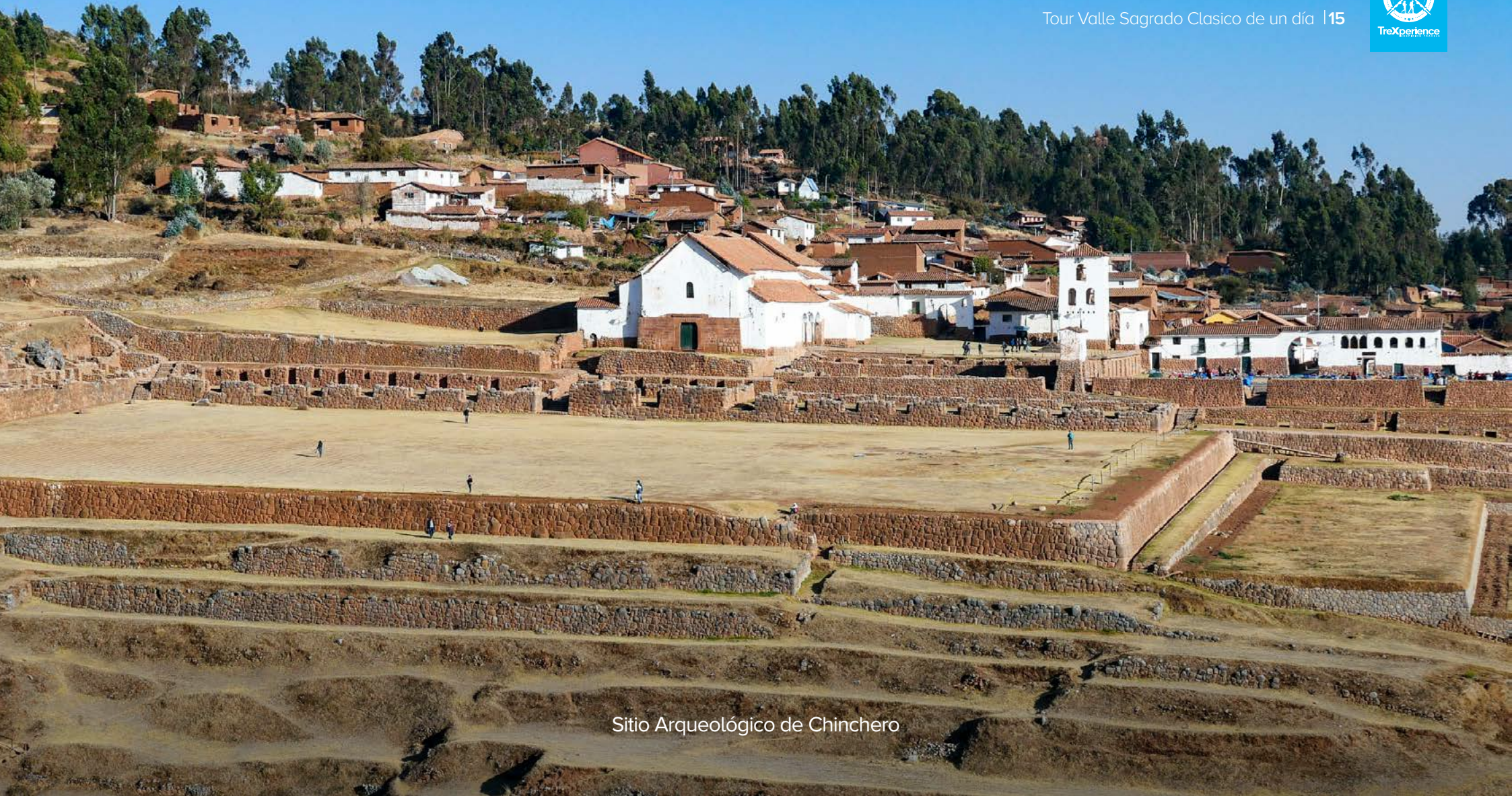
Sitio Arqueológico de Chinchero