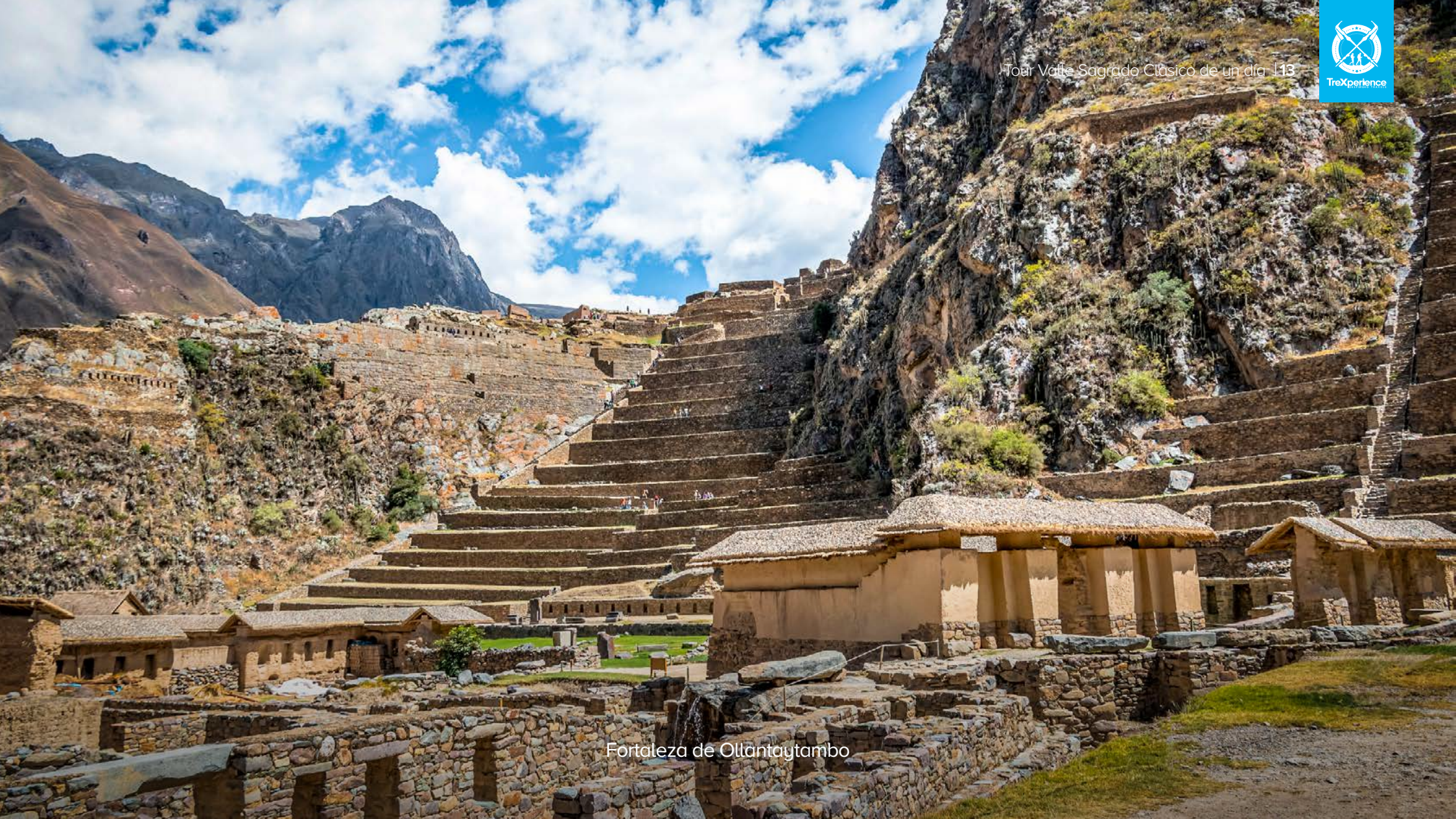
Fortaleza de Ollantaytambo