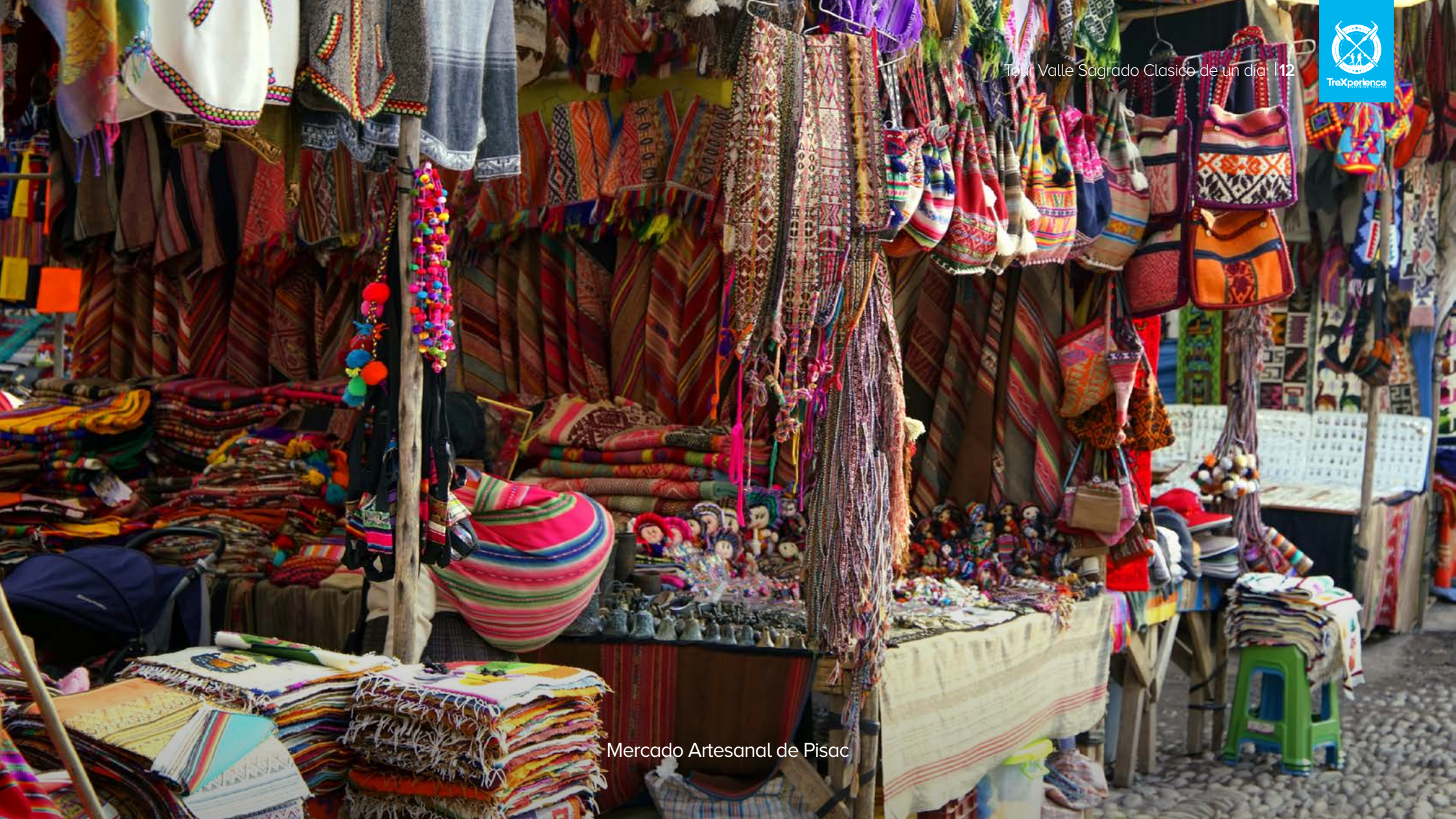
Mercado Artesanal de Pisac