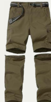
Pantalones para caminata cómodos