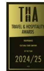
Travel & Hospitality Awards 2022