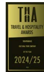
Travel & Hospitality Awards 2025