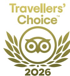
Best of the Best Tripadvisor 2022 a 2026