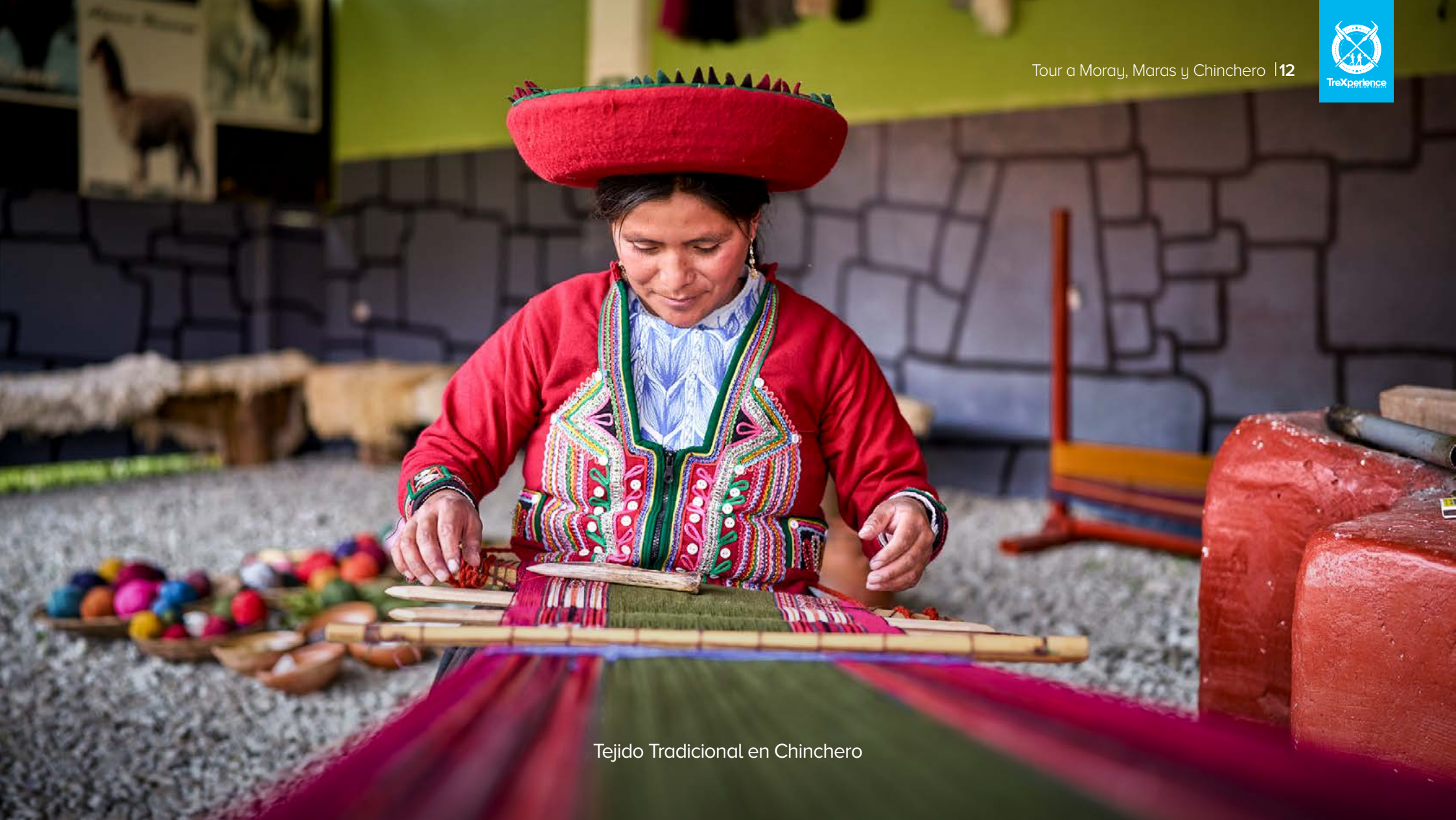
Tejido Tradicional en Chinchero