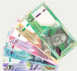
Dinero en efectivo (soles)