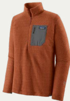
Casaca de polar