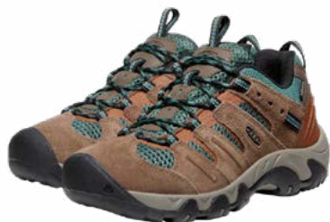
Zapatillas para caminata

Los días de trekking pueden traer sol, viento, lluvia y cambios notables de temperatura. Por eso es importante vestirse en capas y elegir ropa cómoda para caminar. La idea es poder adaptarte fácilmente a las condiciones del clima, manteniéndote seco y abrigado cuando sea necesario.