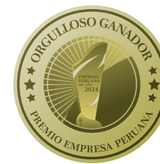
Empresa Peruana del año 2024