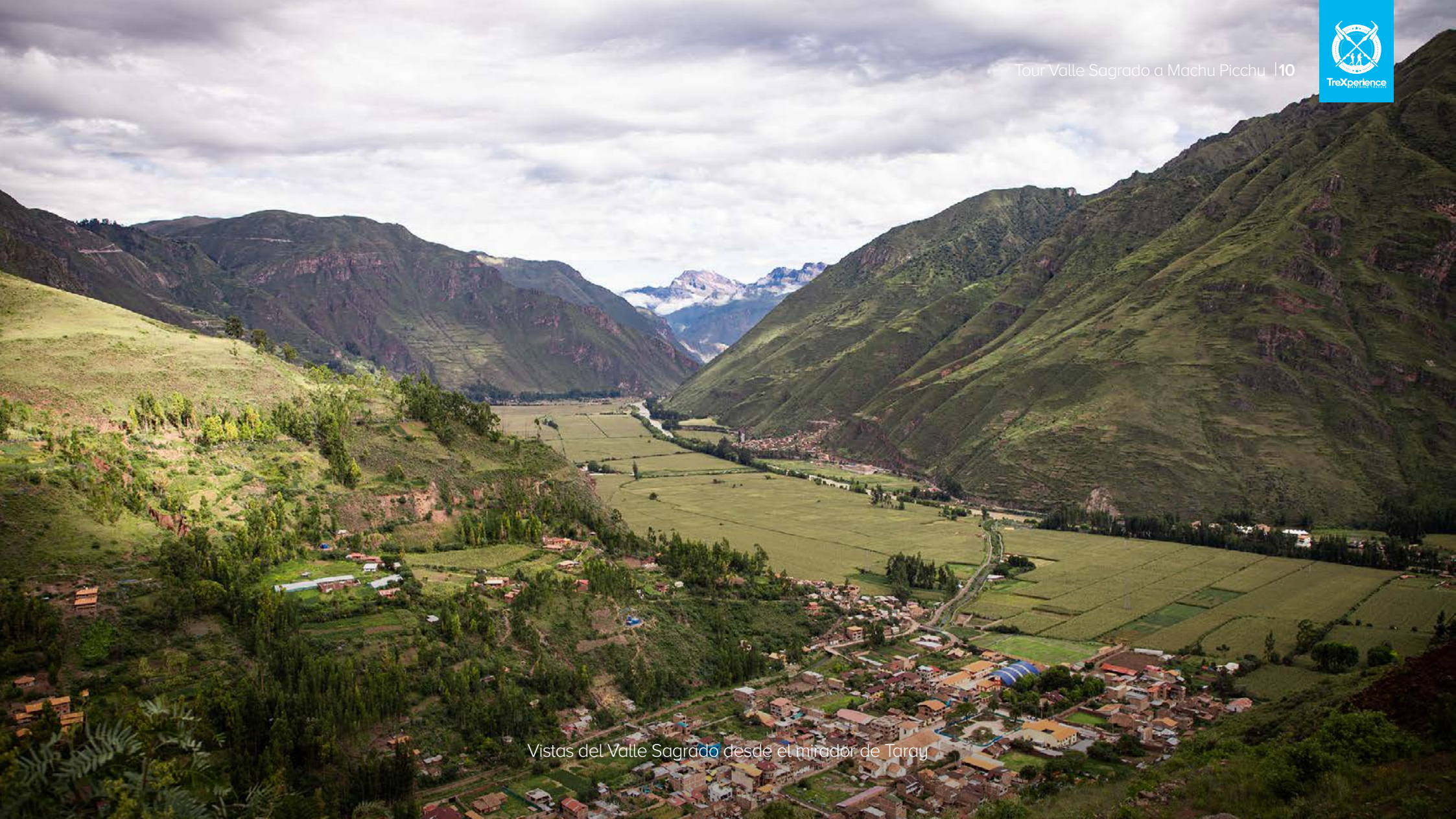
Vistas del Valle Sagrado desde el mirador de Taray