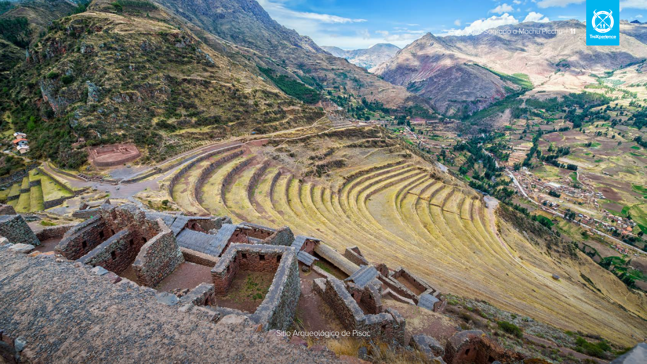
Sitio Arqueológico de Pisac