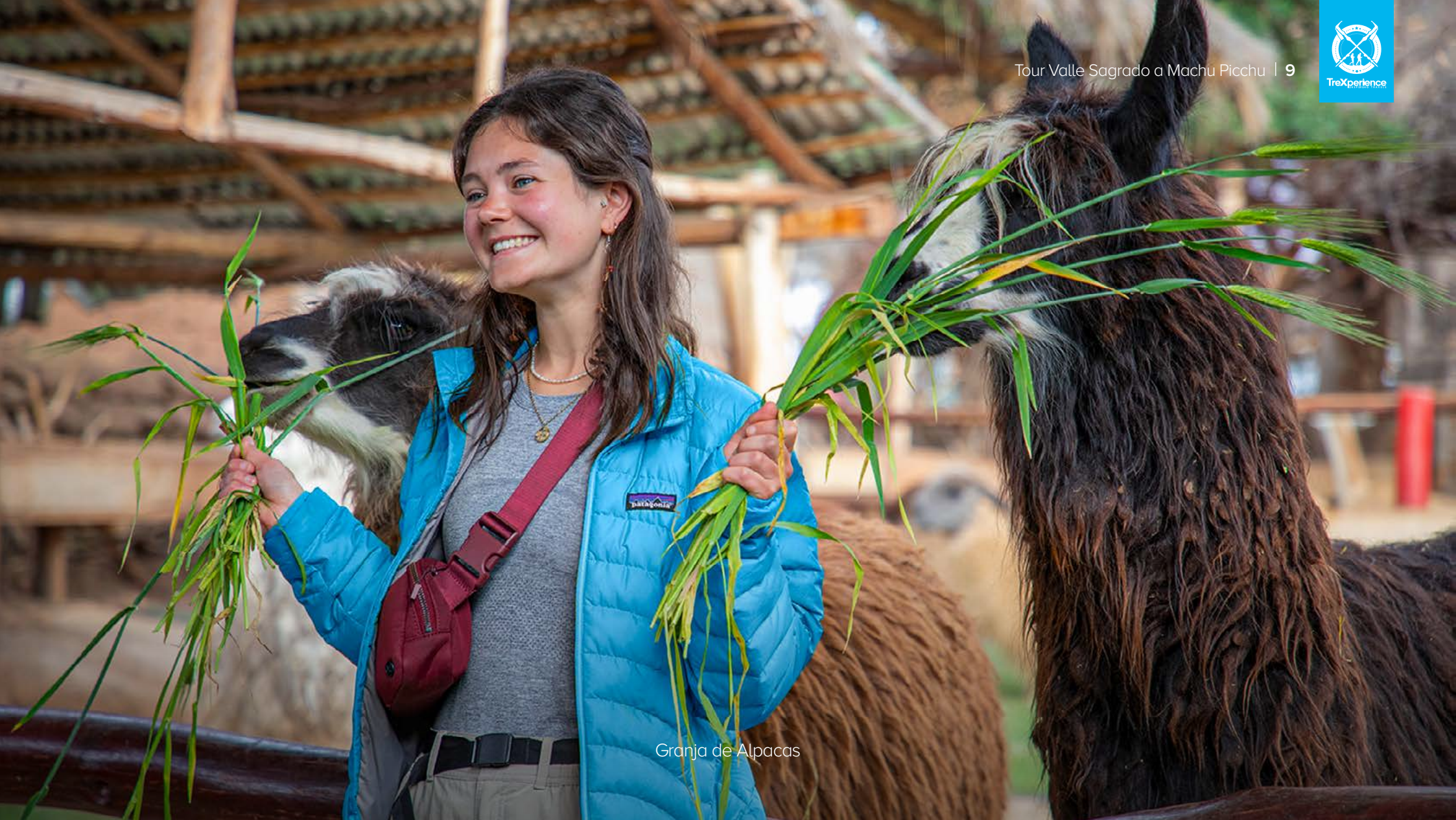
Granja de Alpacas