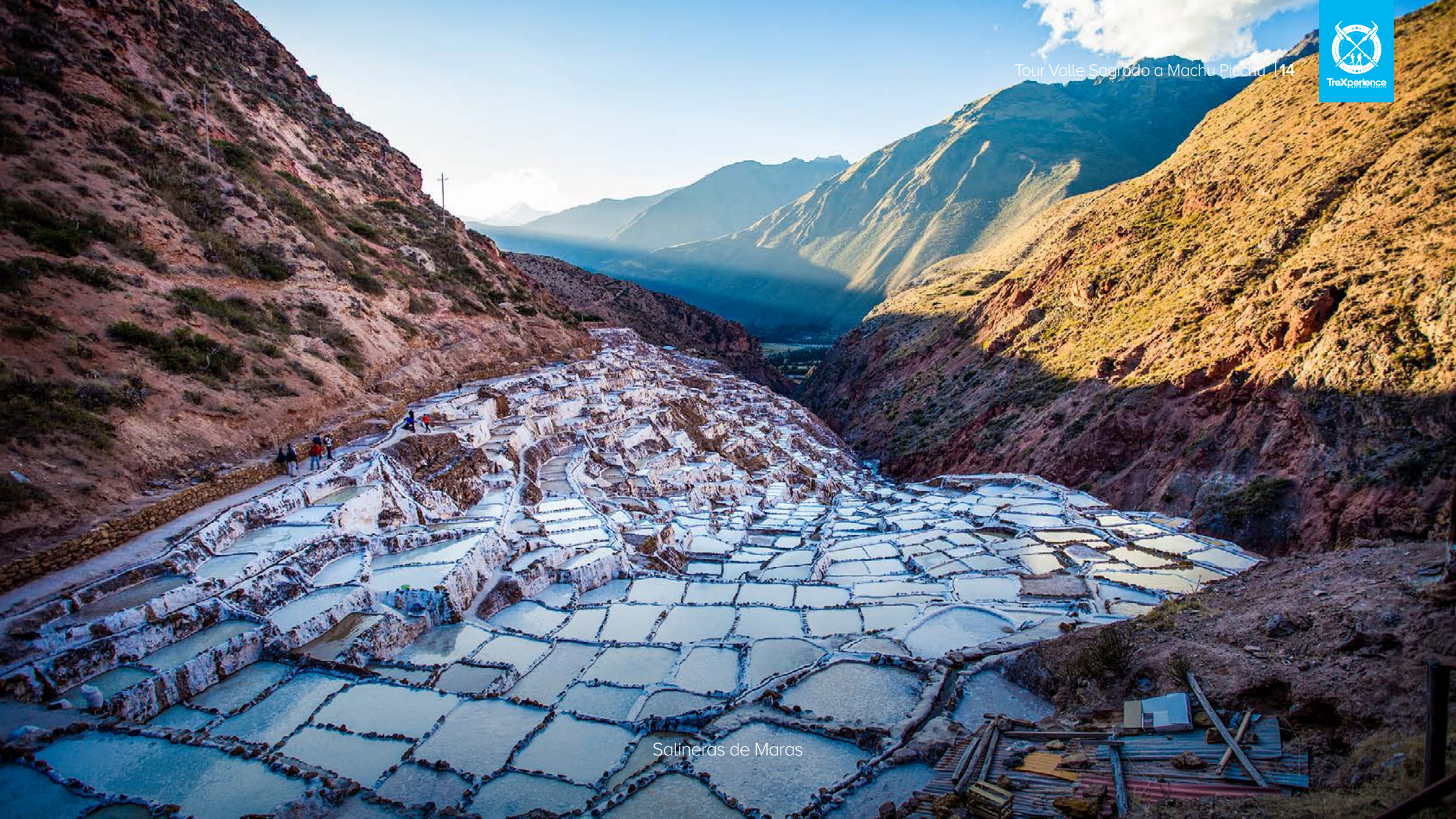
Salineras de Maras