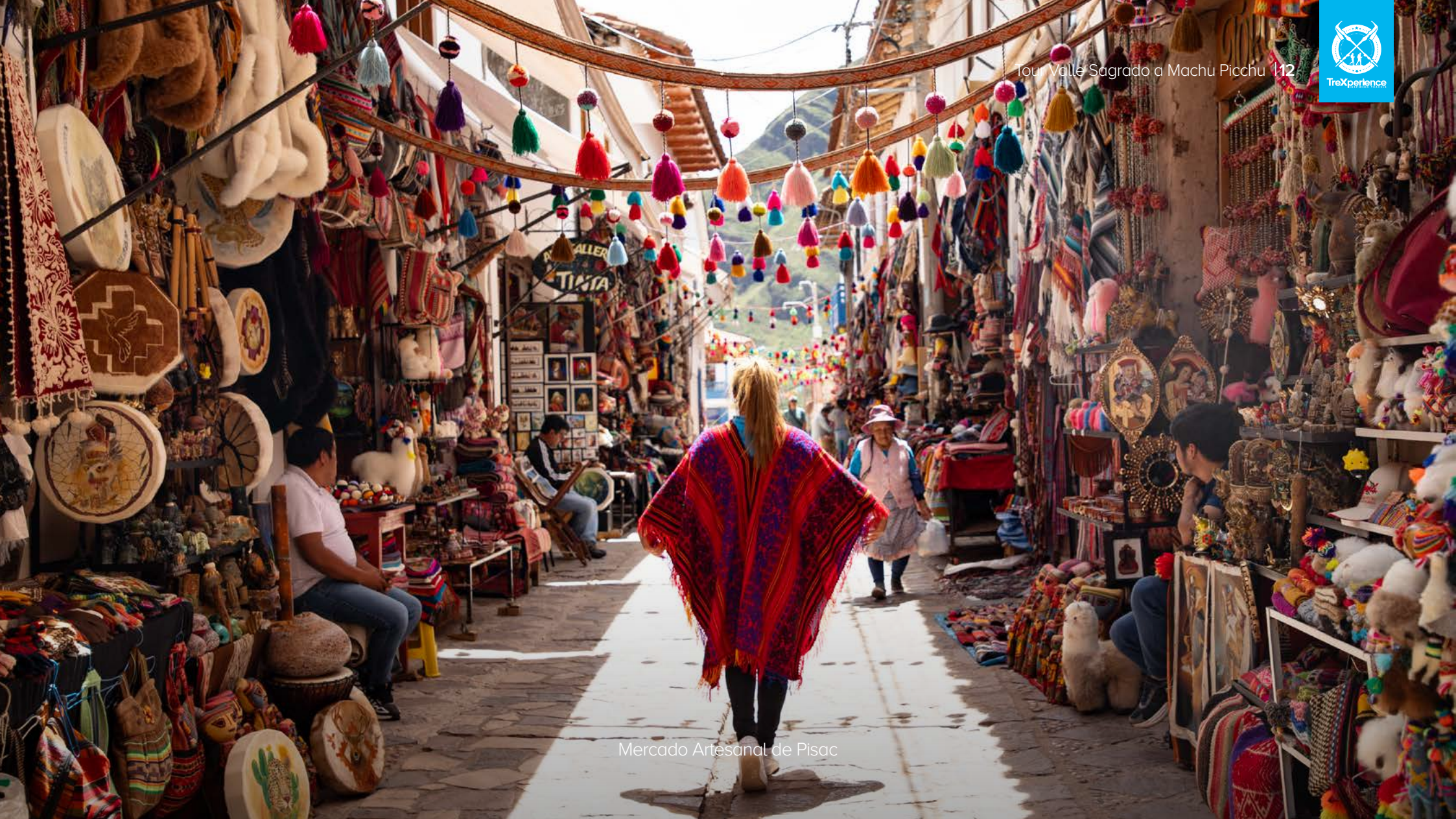
Mercado Artesanal de Pisac