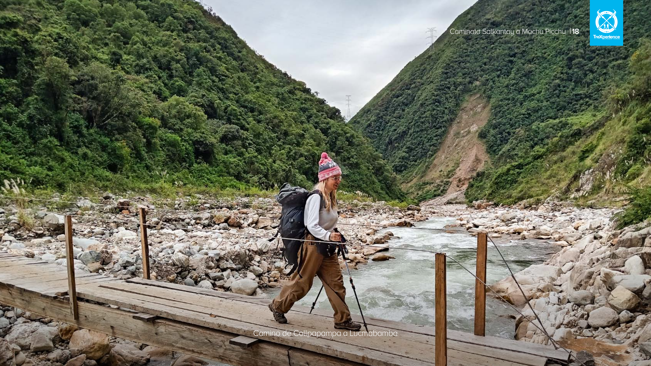
Camino de Collpapampa a Lucmabamba