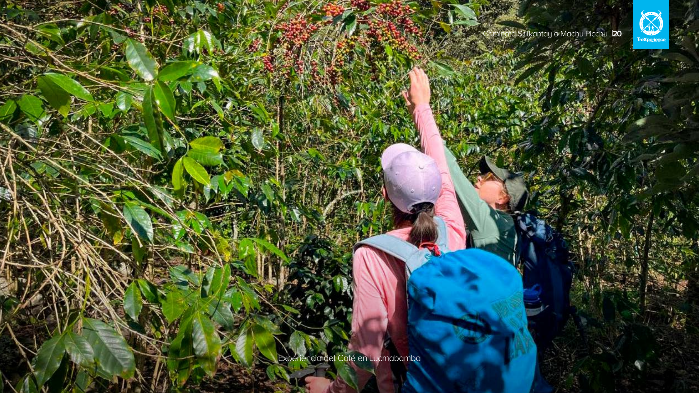
Experiencia del Café en Lucmabamba