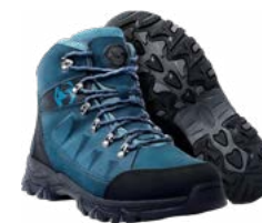
Botas de caminata

Botas de caminata de tu talla, con suela resistente y adherencia