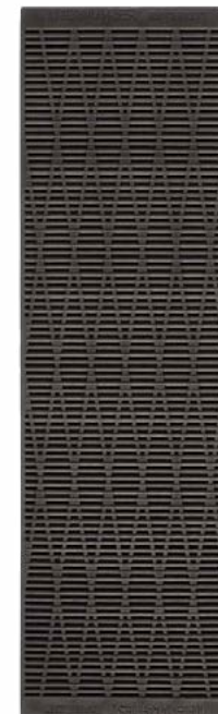
Colchoneta de espuma

Mayor comodidad para tu descanso en campamento.