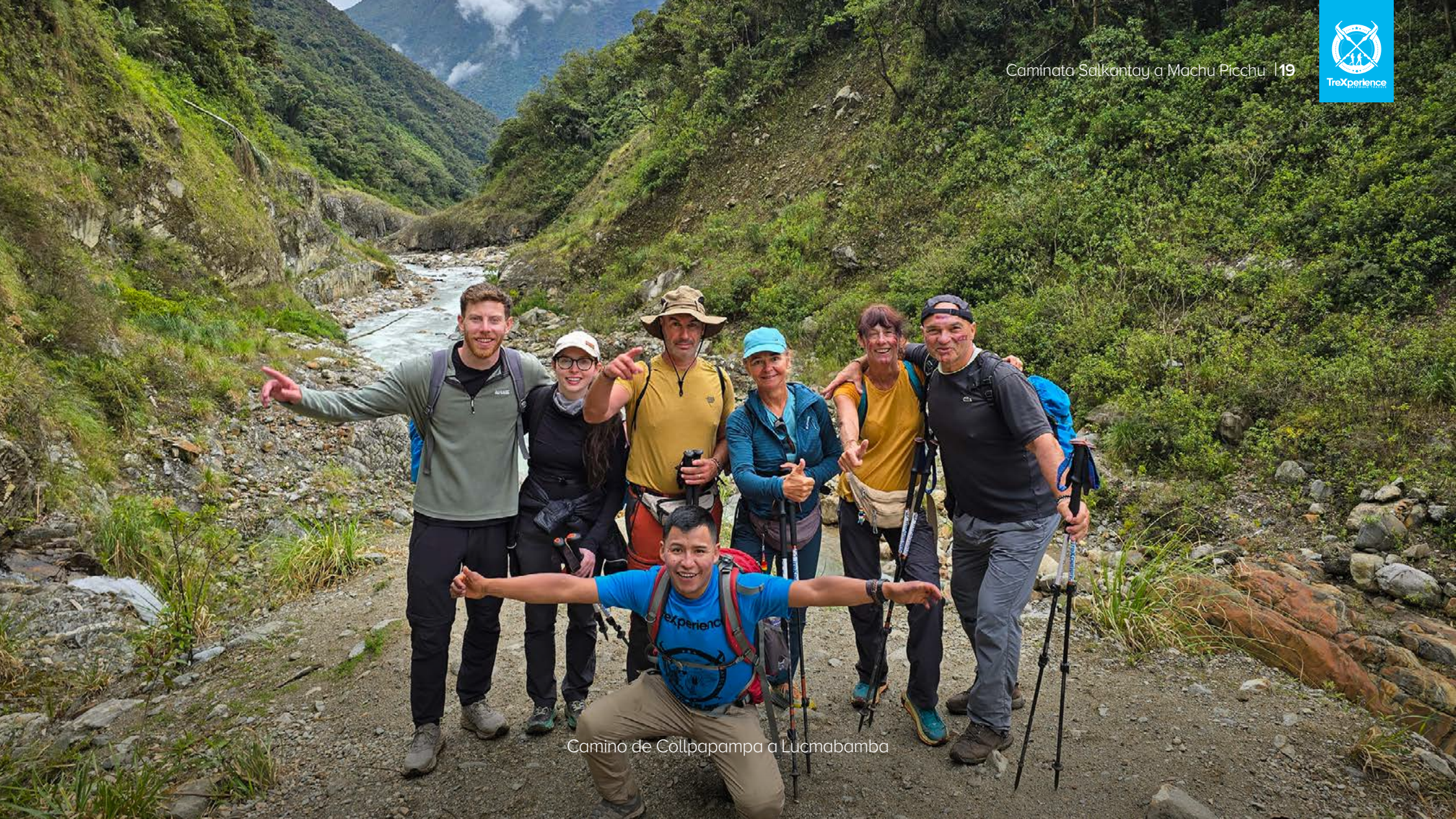
Camino de Collpapampa a Lucmabamba