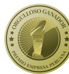
Empresa Peruana del año 2024