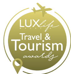
Premios LuxLife 2025