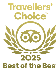
Best of the Best Tripadvisor 2022 a 2025