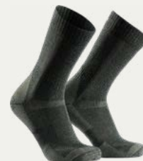
Calcetines de caminata (4-5 pares)

Calzado cómodo, ligero para descansar los pies en el campamento