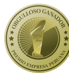
Empresa Peruana del año 2024