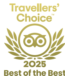
Best of the Best Tripadvisor 2022 a 2025