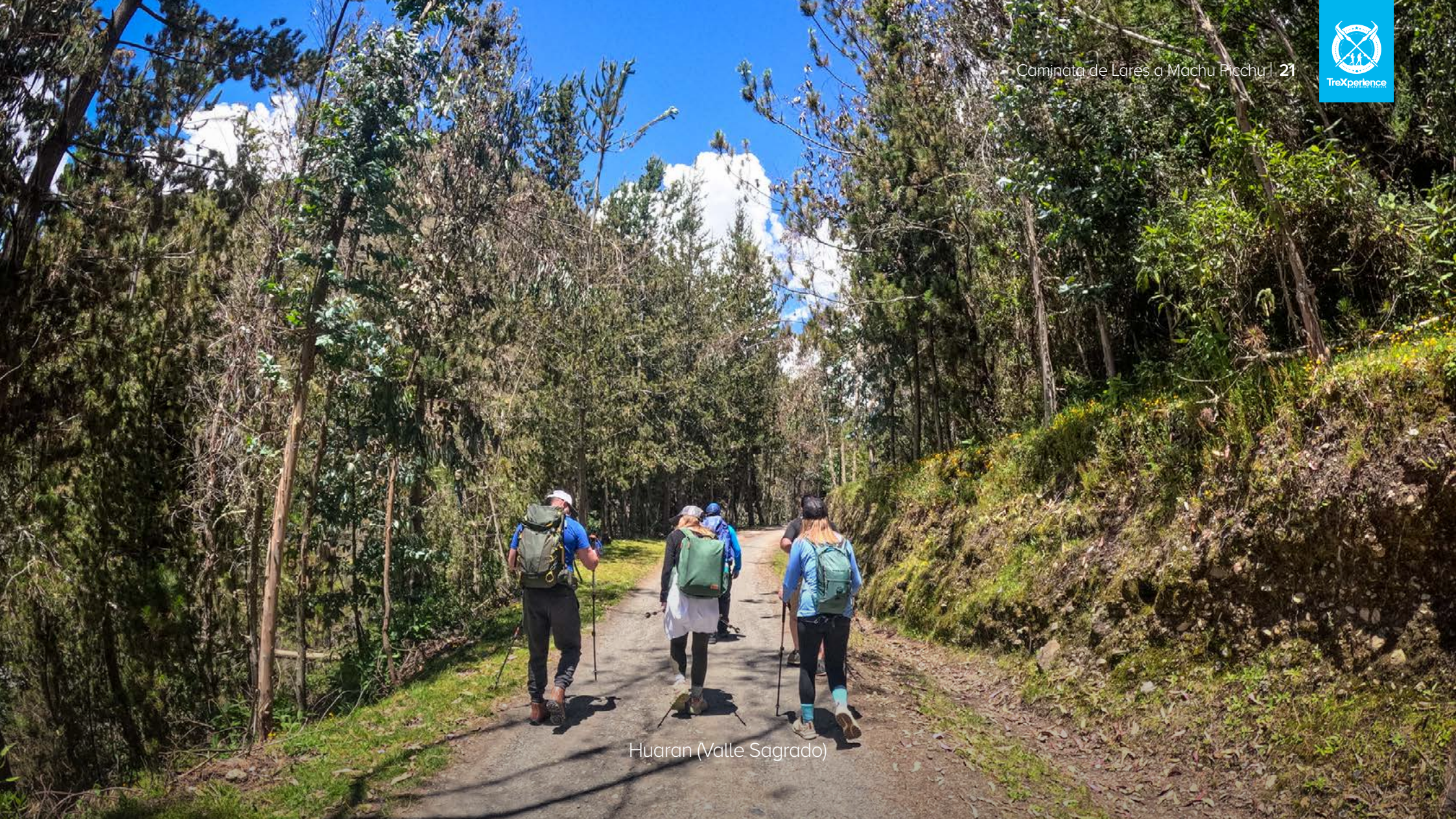
Huaran (Valle Sagrado)