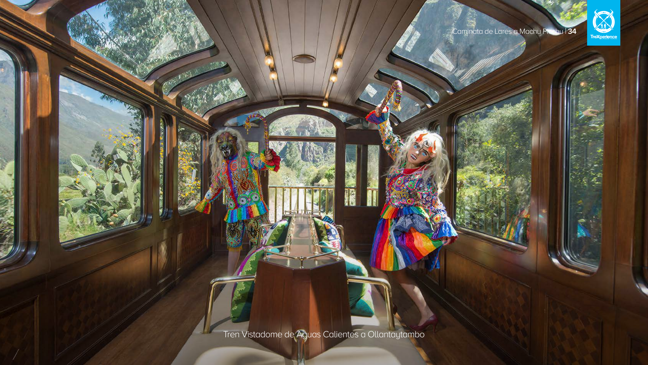
Tren Vistadome de Aguas Calientes a Ollantaytambo