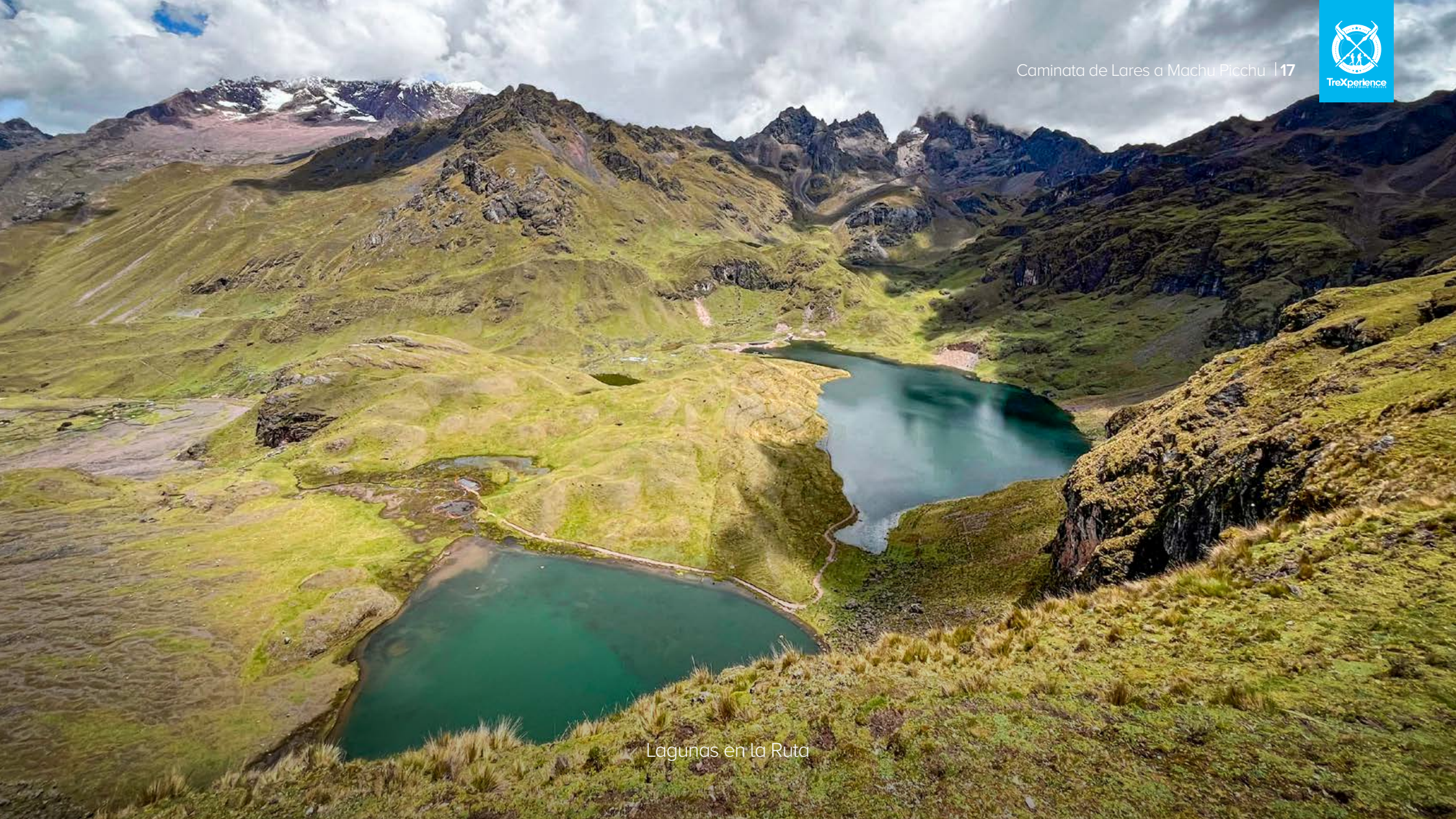
Lagunas en la Ruta