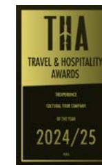
Premio Travel & Hospitality 2024 a 2025