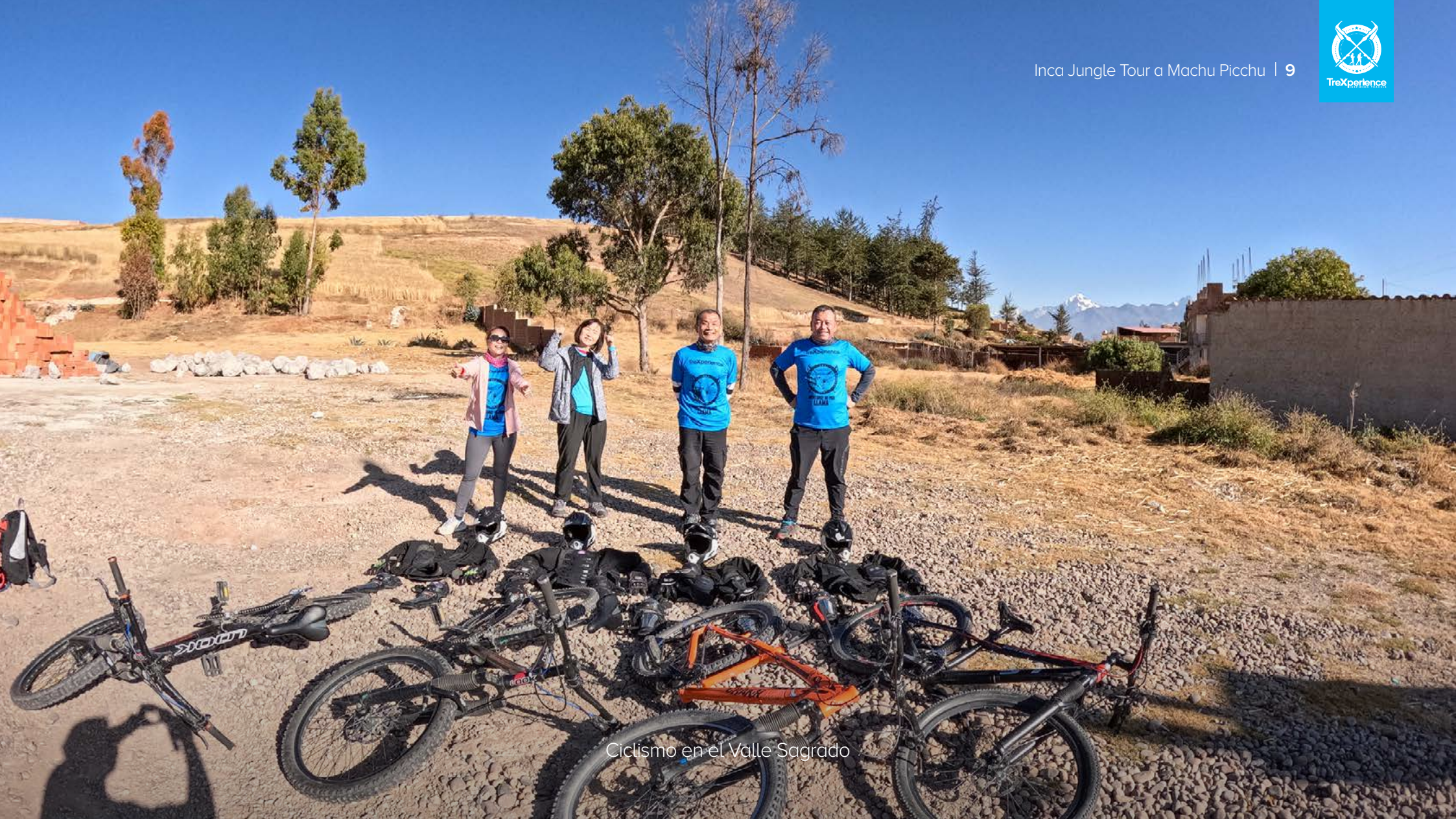
Ciclismo en el Valle Sagrado