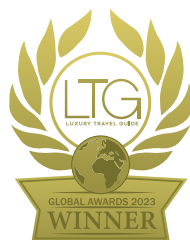
Luxury Travel Guide Global Awards 2023