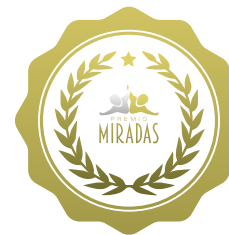
Premio Miradas 2022