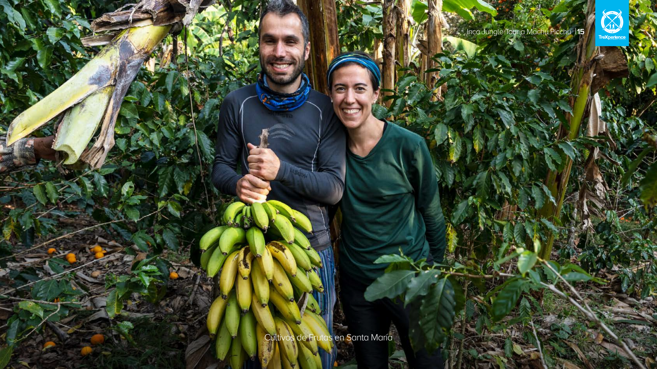
Cultivos de Frutas en Santa María