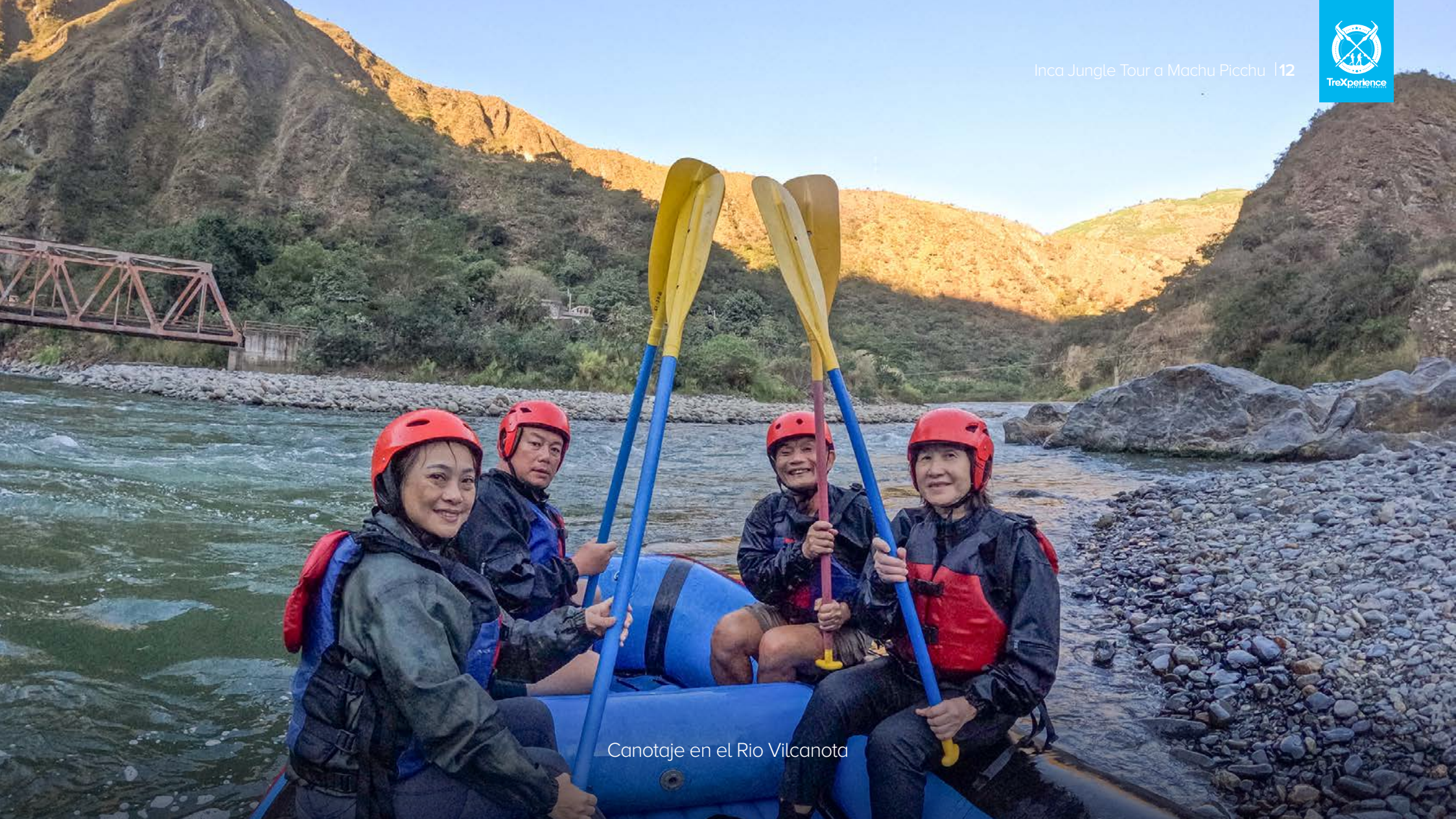
Canotaje en el Rio Vilcanota