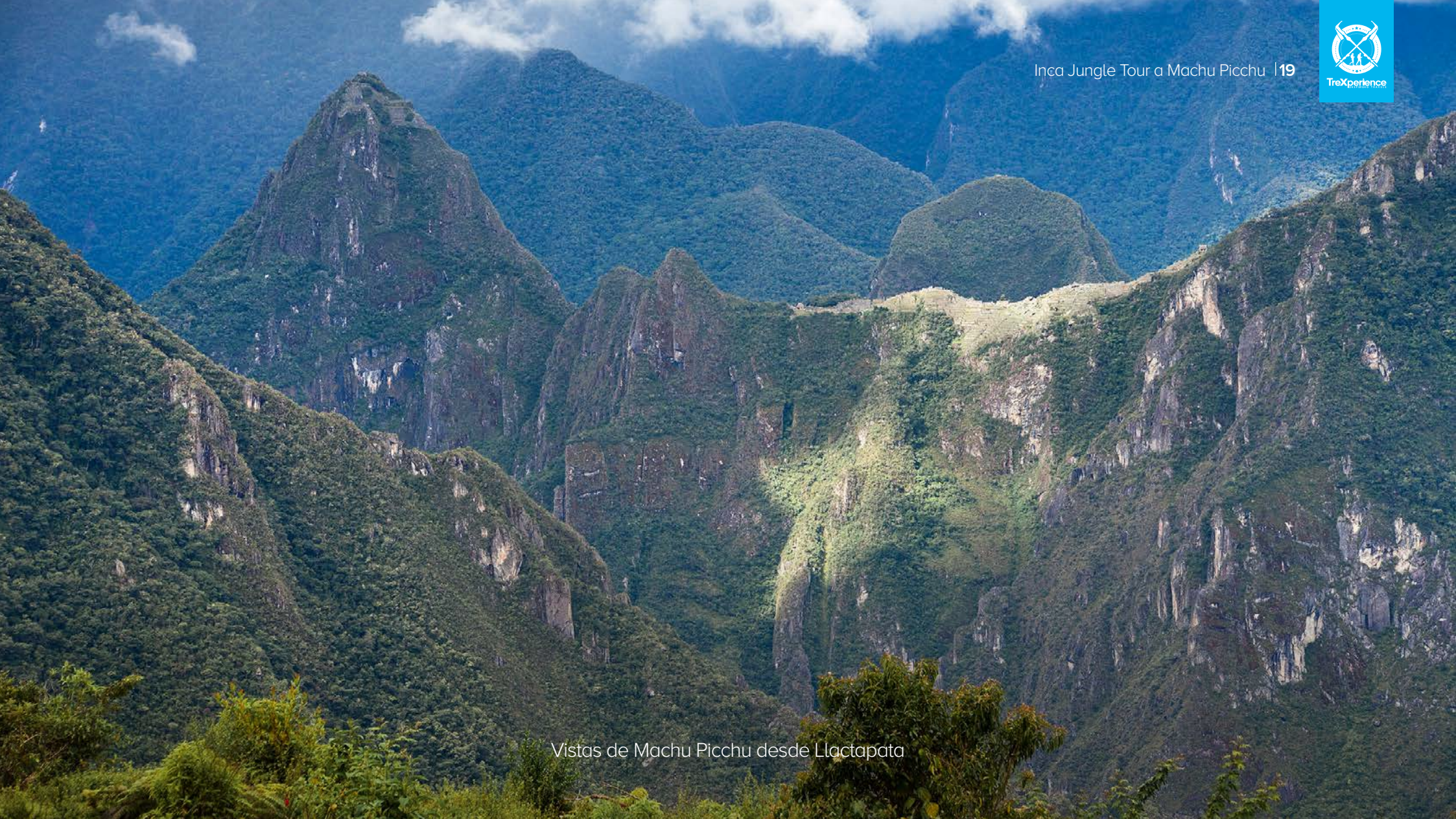
Vistas de Machu Picchu desde Llactapata