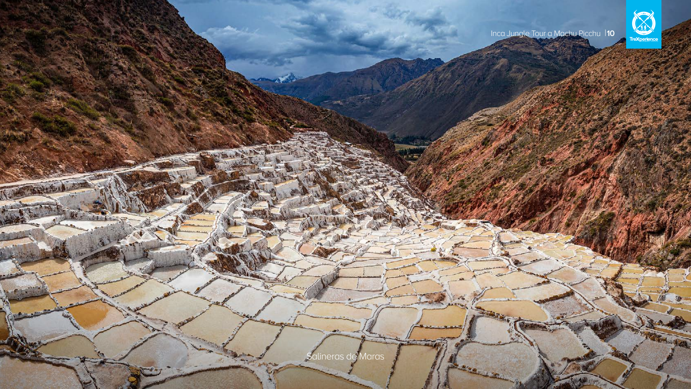
Salineras de Maras