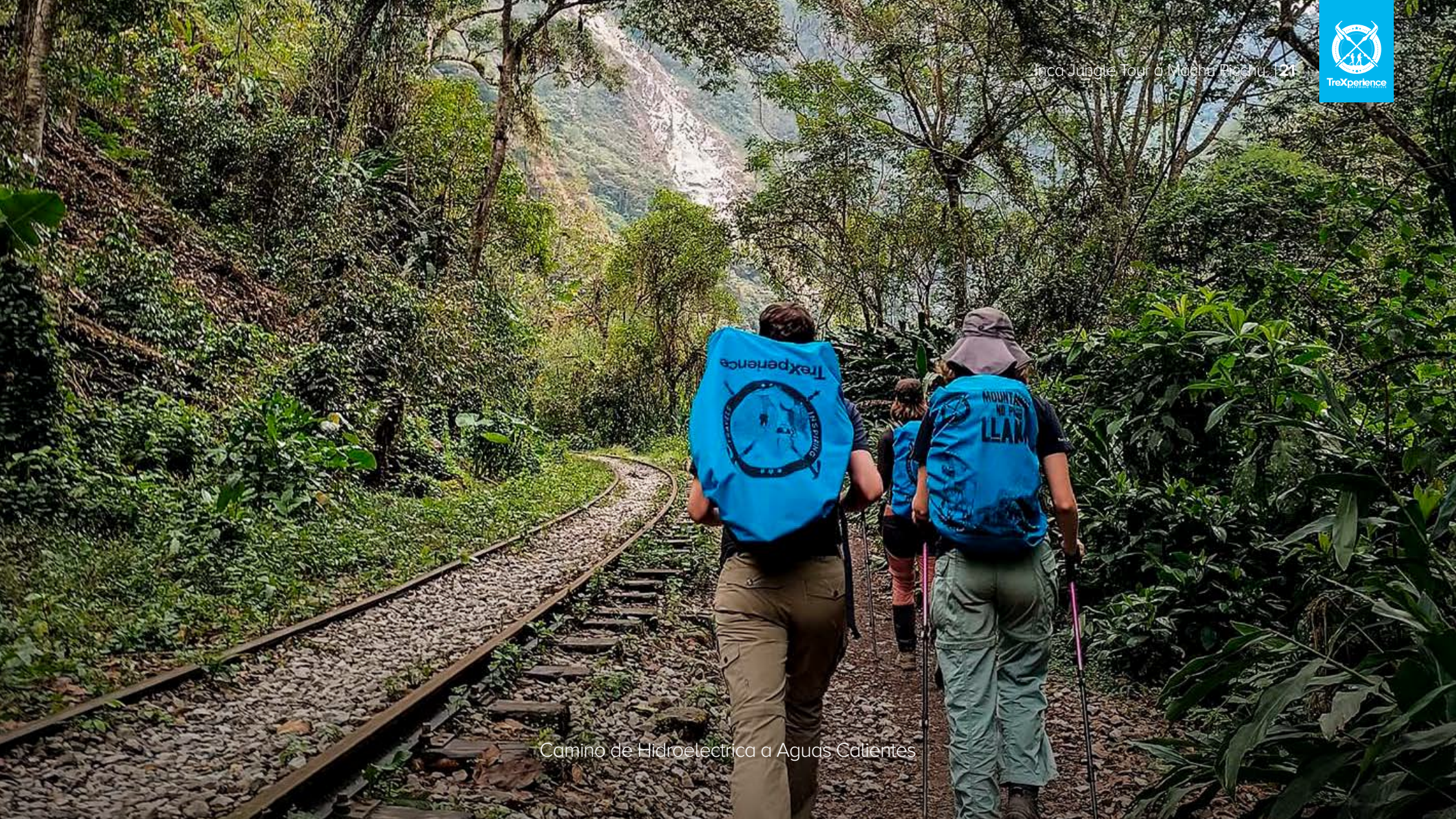
Camino de Hidroeléctrica a Aguas Calientes