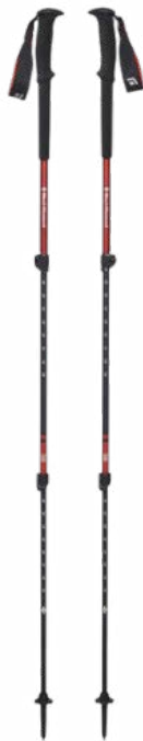
Bastones de caminata

Si lo prefieres, puedes alquilar con nosotros el equipo adicional que hará tu experiencia más cómoda: bastones de trekking para un mejor soporte, sleeping bag para tus noches de campamento y matra inflable para un descanso reparador.