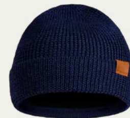
Gorro de lana

Botas de caminata de tu talla, con suela resistente y adherencia