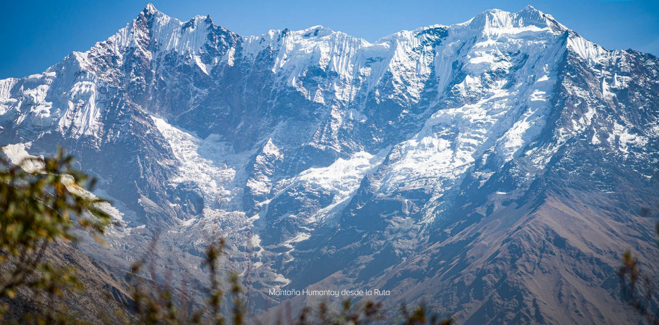
Montaña Humantay desde la Ruta