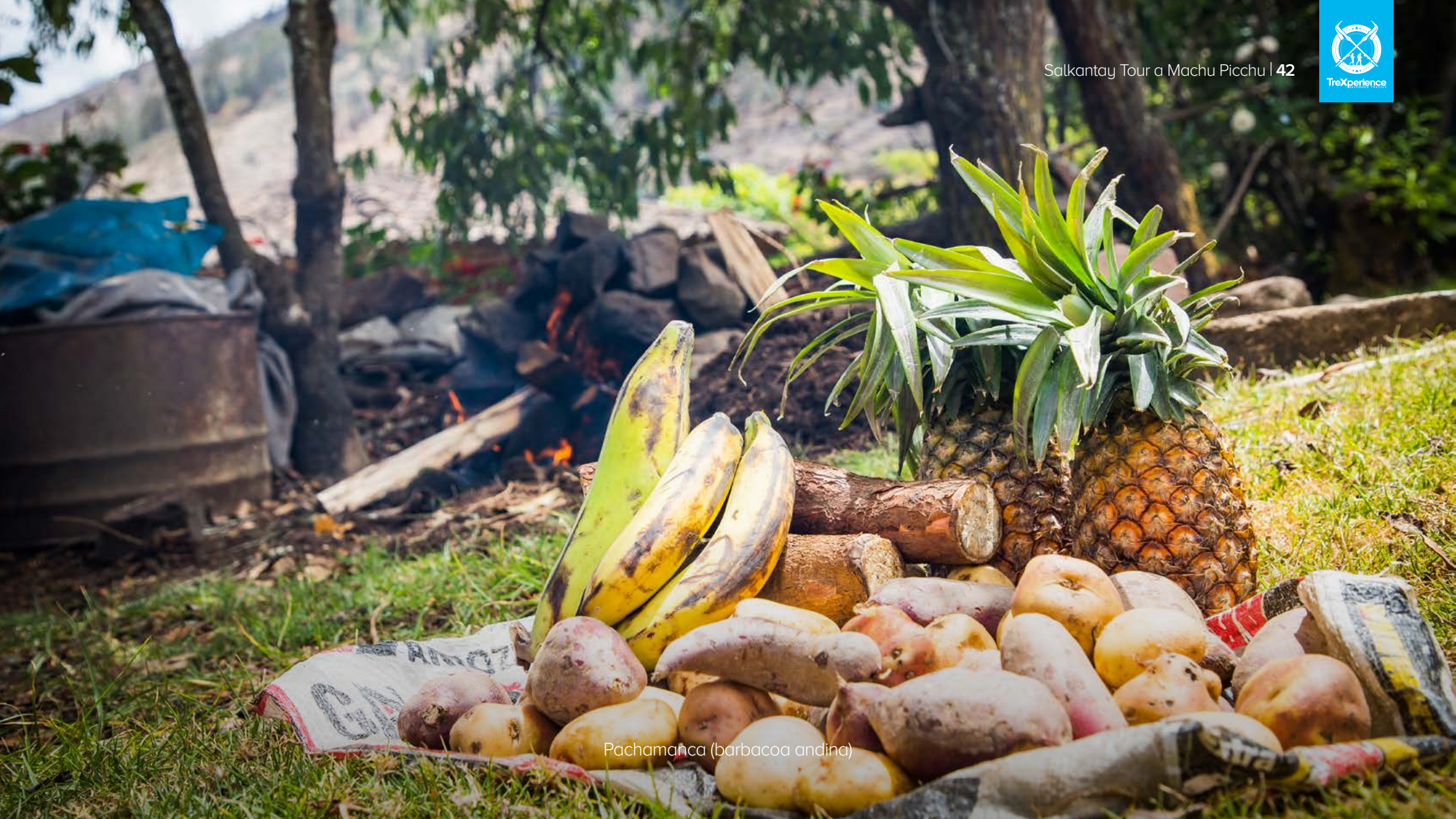
Pachamanca (barbacoa andina)