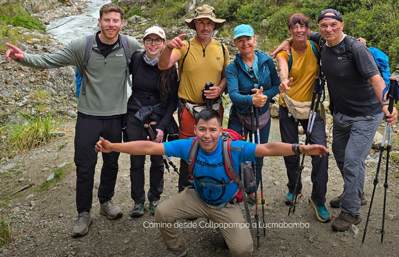
Camino desde Collpapampa a Lucmabamba