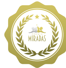
Premio Miradas 2022