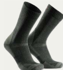
Calcetines de caminata (4-5 pares)

Calzado cómodo, ligero para descansar los pies en el campamento