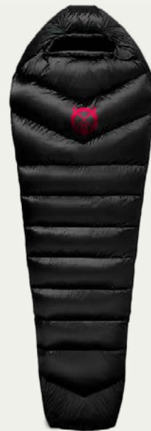
Bolsa de dormir

Calor y comodidad en noches frías de montaña.