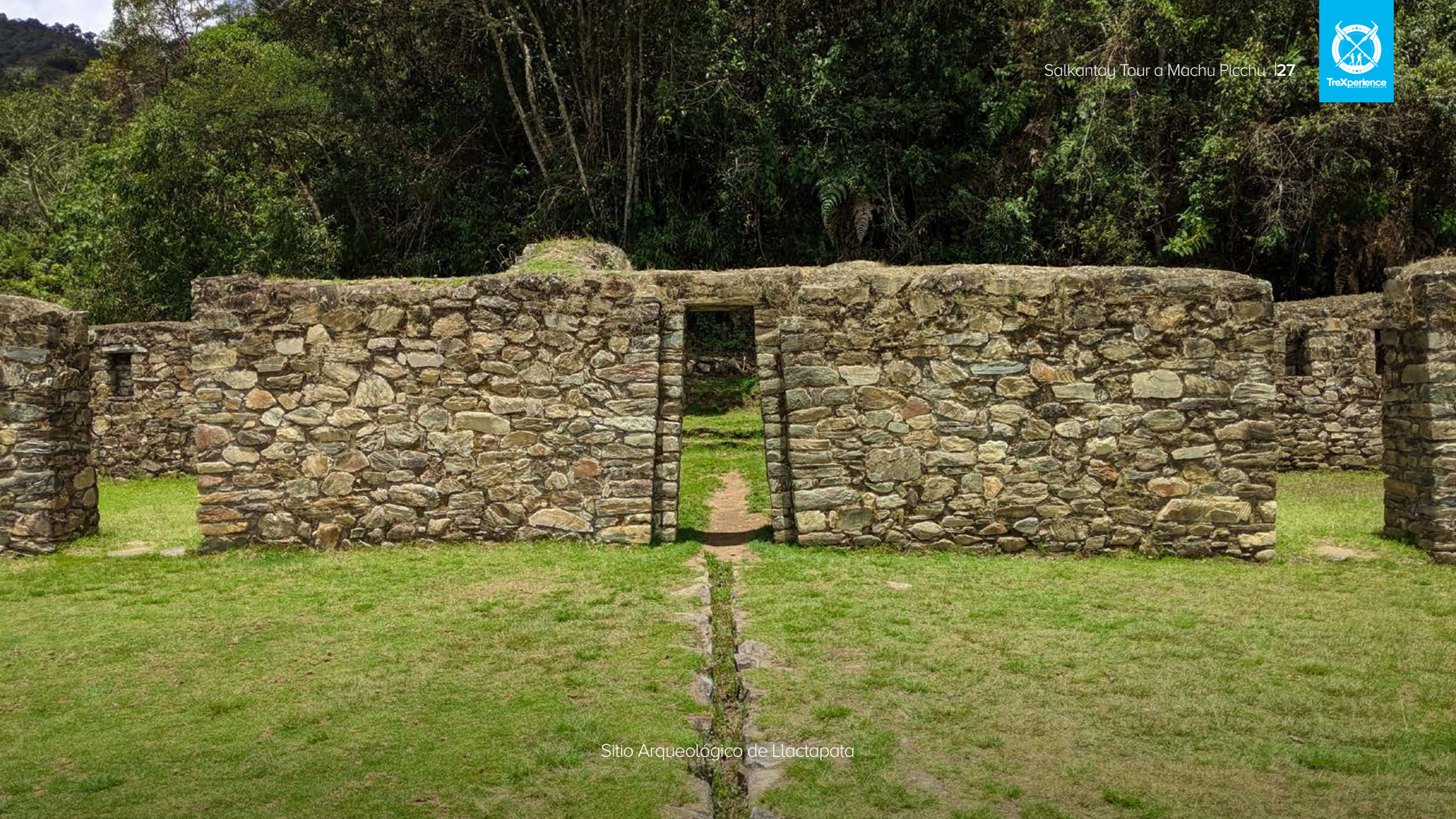
Sitio Arqueológico de Llaqtapata