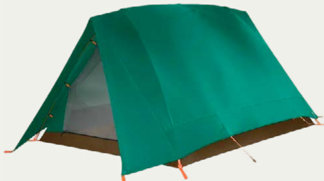
Carpa privada para dormir

En cada caminata no escatimamos en calidad ni en seguridad: carpas de descanso amplias y resistentes, carpa comedor y carpa-baño de marcas certificadas. Además, llevamos oxígeno y teléfonos satelitales para tu tranquilidad en todo momento.