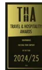
Travel & Hospitality Awards 2022