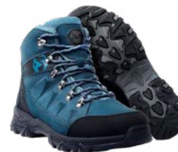
Botas de caminata

Botas de caminata de tu talla, con suela resistente y adherencia