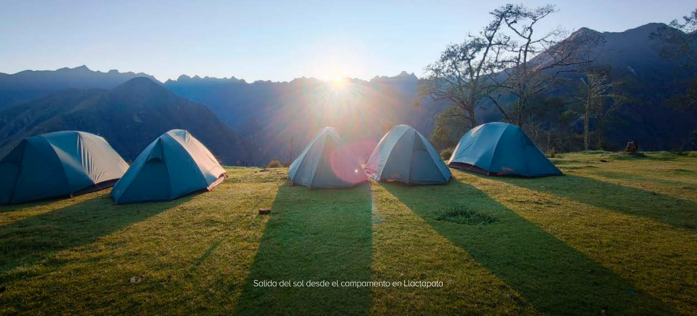
Salida del sol desde el campamento en Llaqtapata