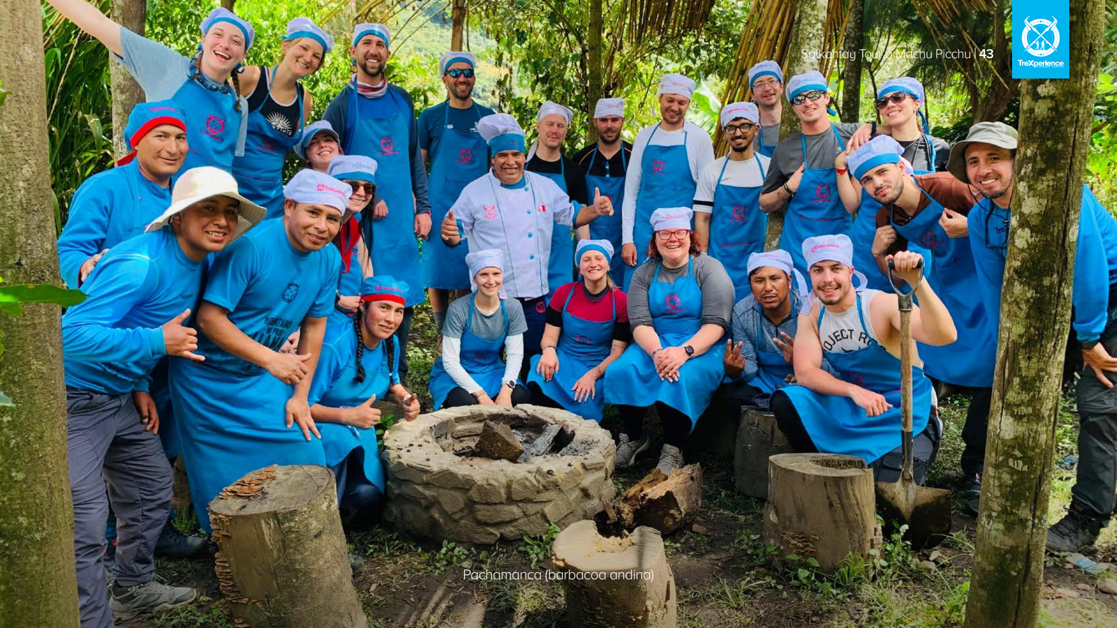
Pachamanca (barbacoa andina)