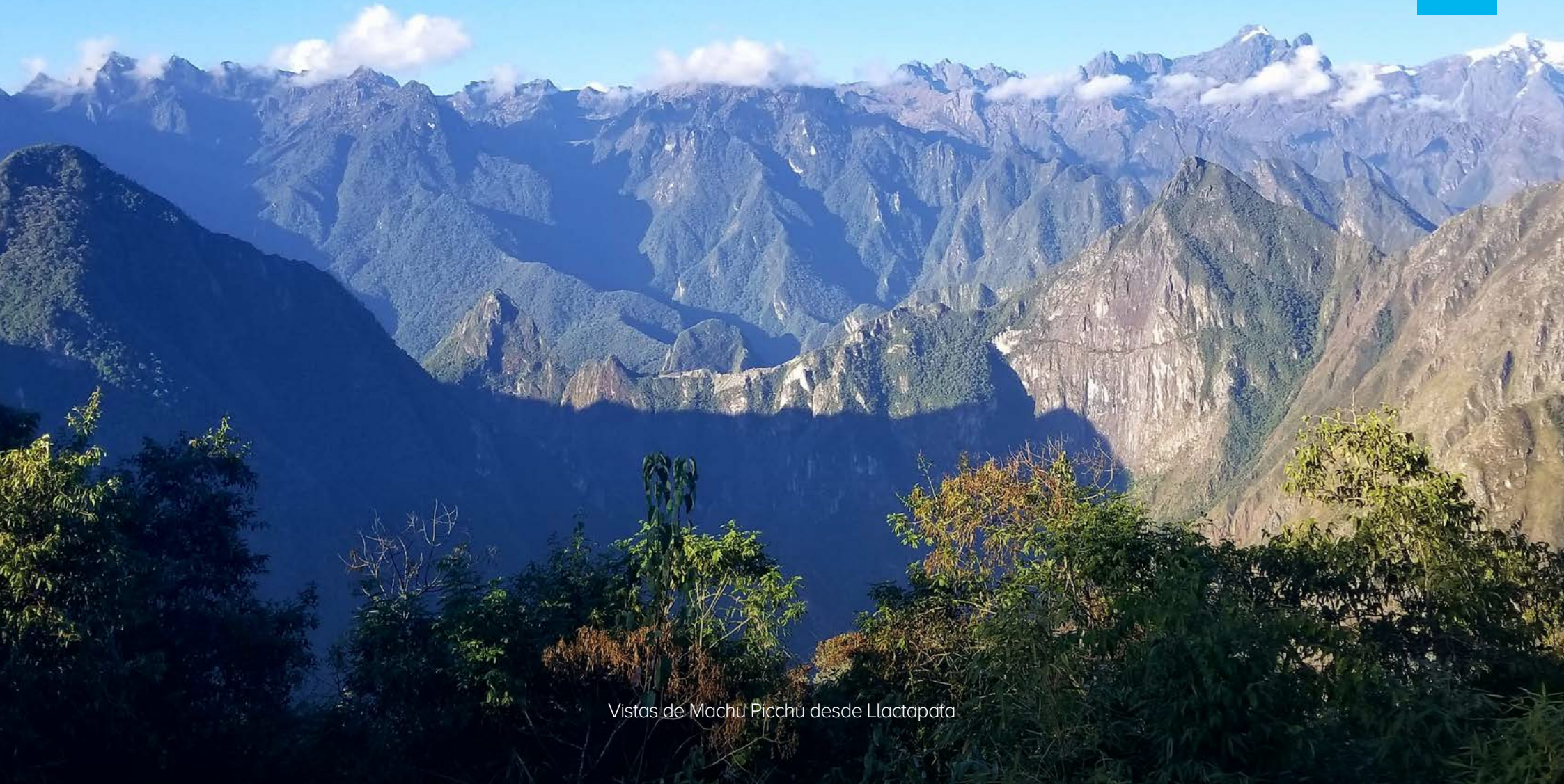
Vistas de Machu Picchu desde Llactapata