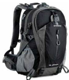
Mochila (25- 40L)

Al prepararte para la Caminata Salkantay, es importante empacar adecuadamente para la altitud, el clima frío y el terreno accidentado. Aquí hay algunos artículos esenciales que debes llevar: