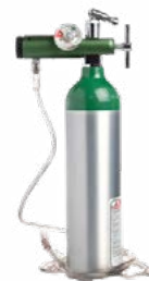
Tanque de oxígeno

Espacio cómodo para compartir las comidas.