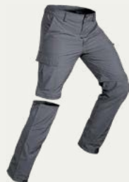
Pantalones de trekking (2 pares)

Casaca con aislamiento térmico para noches más frías.