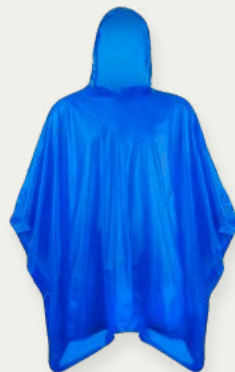
Poncho de lluvia

Durante el trek, nos ocupamos de tu comodidad: Tendrás a tu disposición un dufflebag que será trasladado por nuestro equipo. También incluimos un poncho para la lluvia, cobertor impermeable de mochila, polo de la empresa y una matra de espuma para tu descanso.