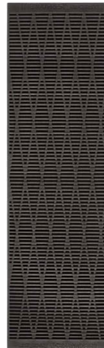
Colchoneta de espuma

Mayor comodidad para tu descanso en campamento.