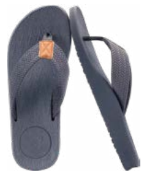
Sandalias o calzado ligero

Pantalones convertibles ligeros para todo clima.