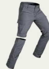
Pantalones de trekking (2 pares)

Pantalones convertibles ligeros para todo clima.