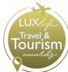
Lux Life Travel & Tourism awards 2022