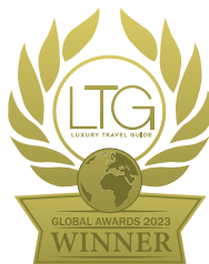
Luxury Travel Guide Global Awards 2023