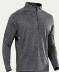
Camiseta manga larga

Al prepararte para la Caminata de Huchuy Qosqo y Camino Inca Corto es importante empacar adecuadamente para la altitud, el clima frío y el terreno accidentado. Aquí hay algunos artículos esenciales que debes llevar: