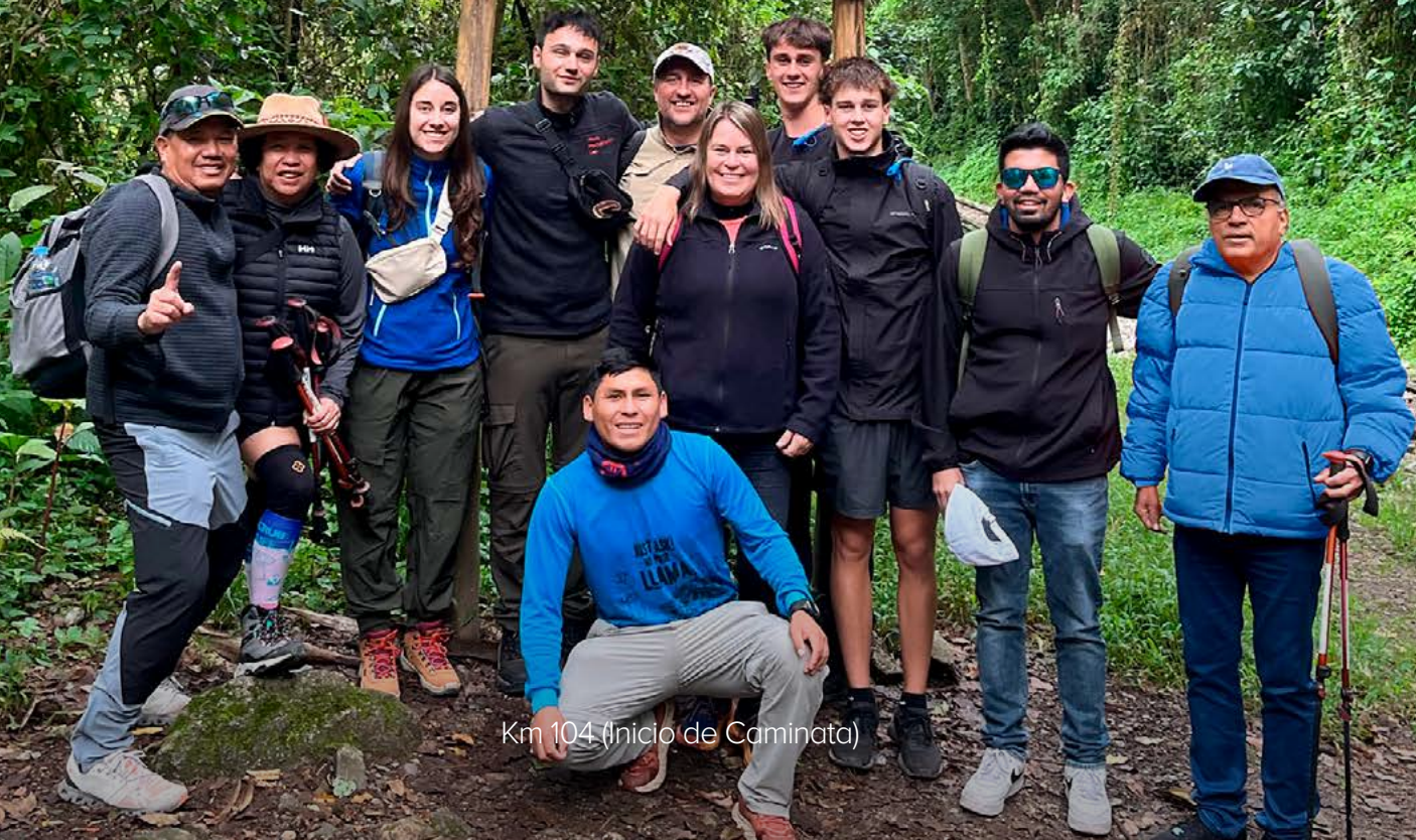
Km 104 (Inicio de Caminata)