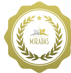
Premio Miradas 2022