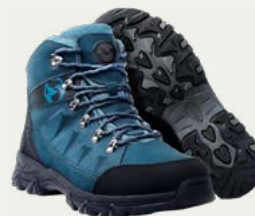
Botas de caminata

Calzado cómodo, ligero para descansar los pies en el campamento