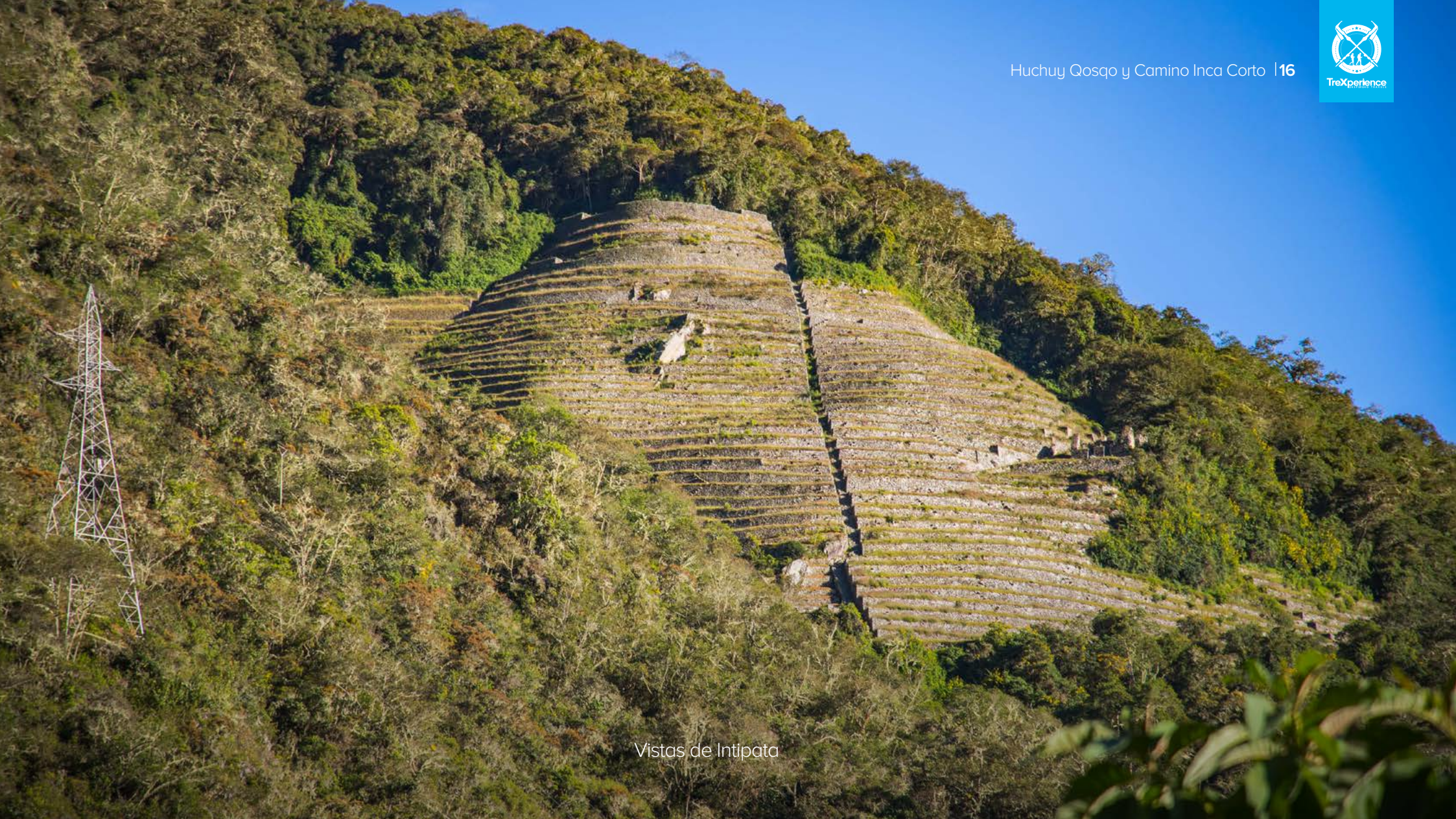
Vistas de Intipata