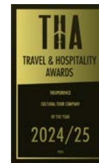
Travel & Hospitality Awards 2022