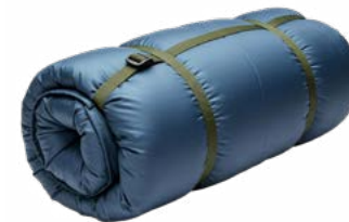
Bolsa de dormir

Calor y comodidad en noches frías de montaña.