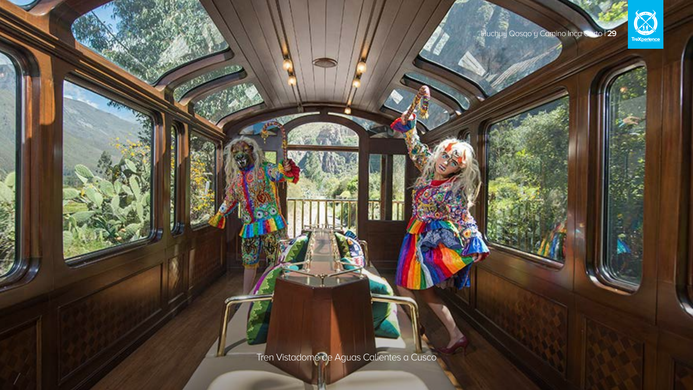
Tren Vistadome de Aguas Calientes a Cusco