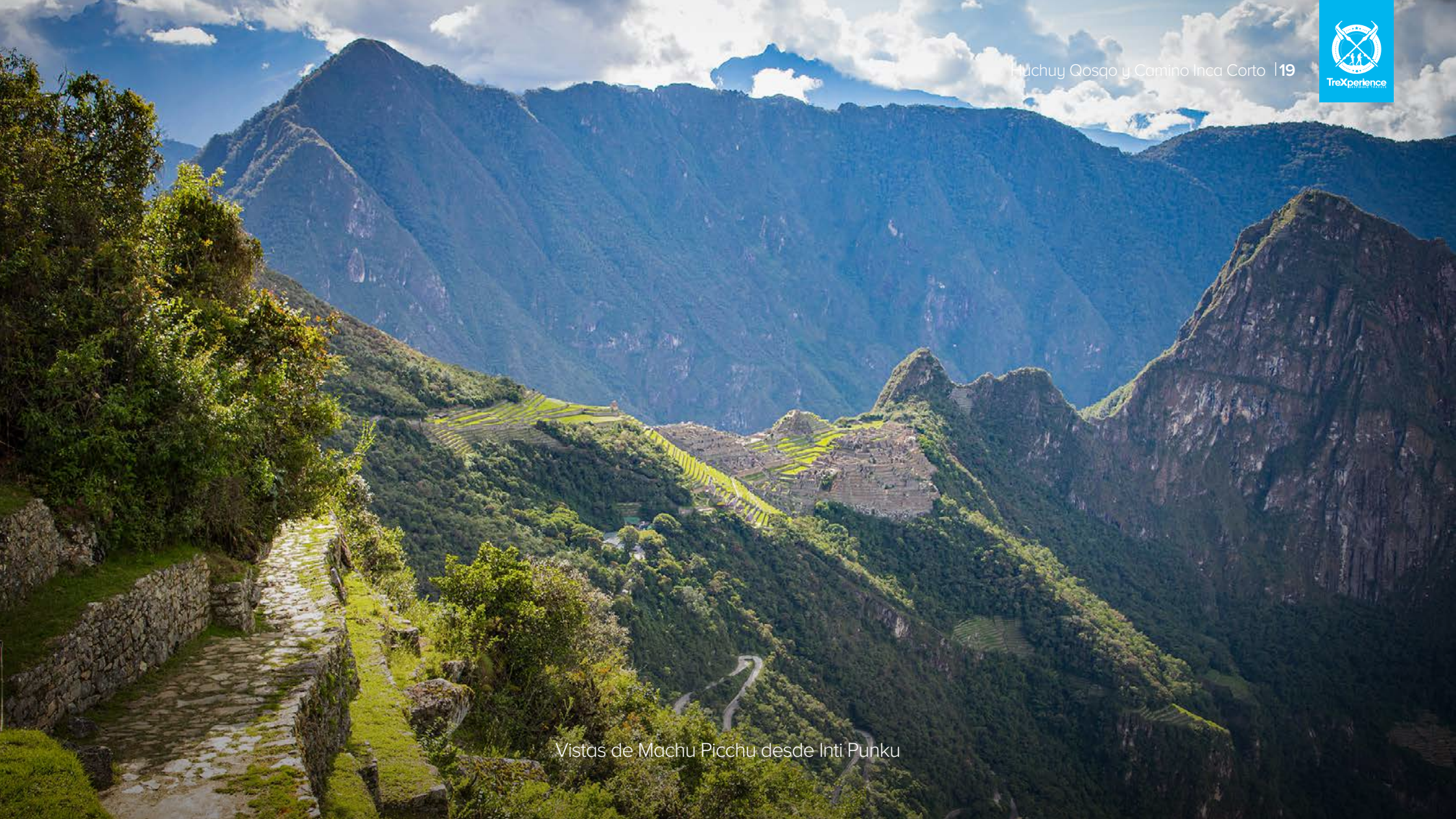
Vistas de Machu Picchu desde Inti Punku