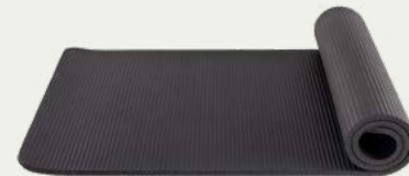
Colchoneta de espuma

Mayor comodidad para tu descanso en campamento.