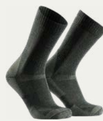
Calcetines de caminata (4-5 pares)

Calzado cómodo, ligero para descansar los pies en el campamento