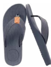
Sandalias o calzado ligero

Pantalones convertibles ligeros para todo clima.