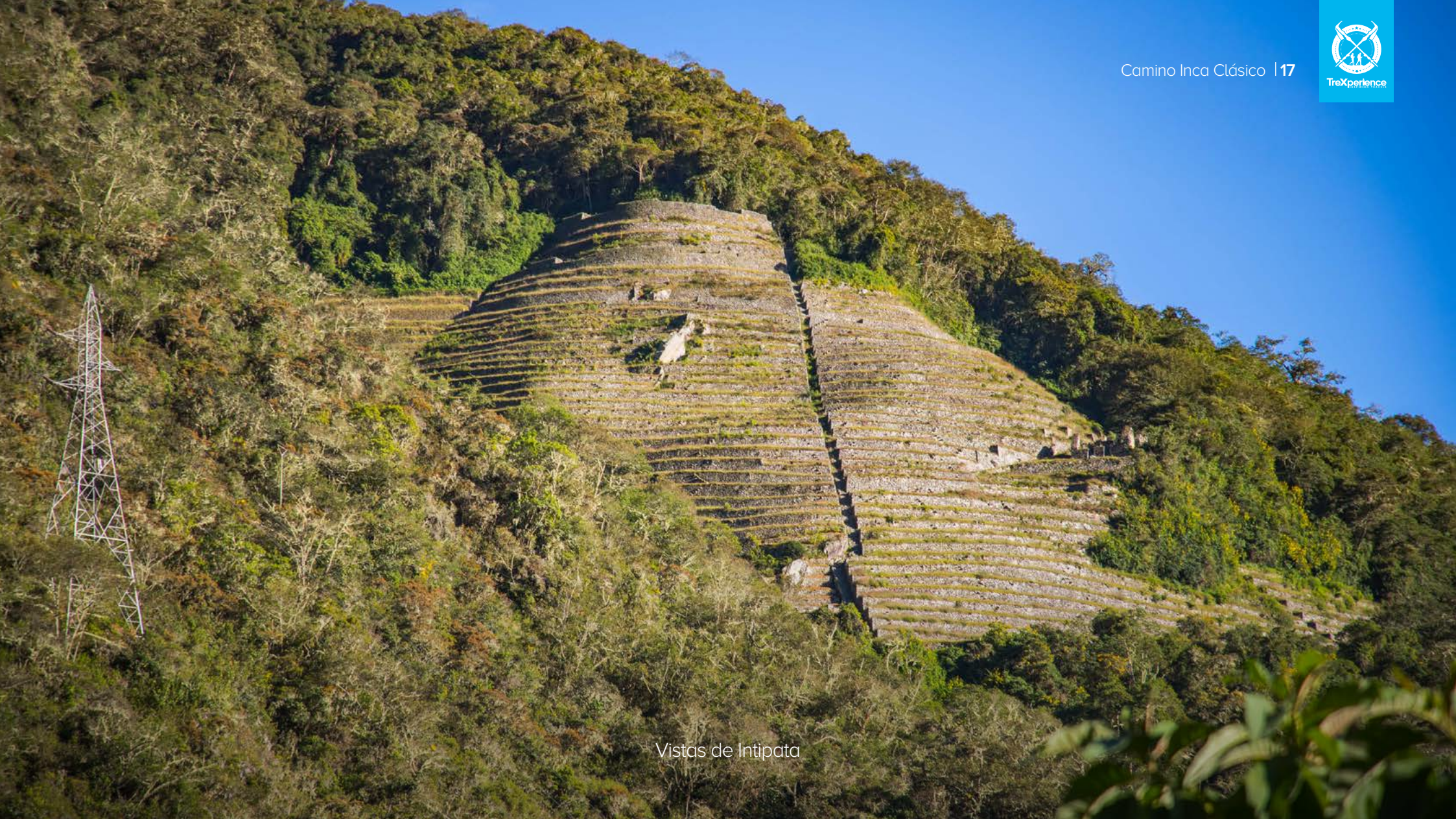
Vistas de Intipata