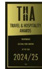
Travel & Hospitality Awards 2022