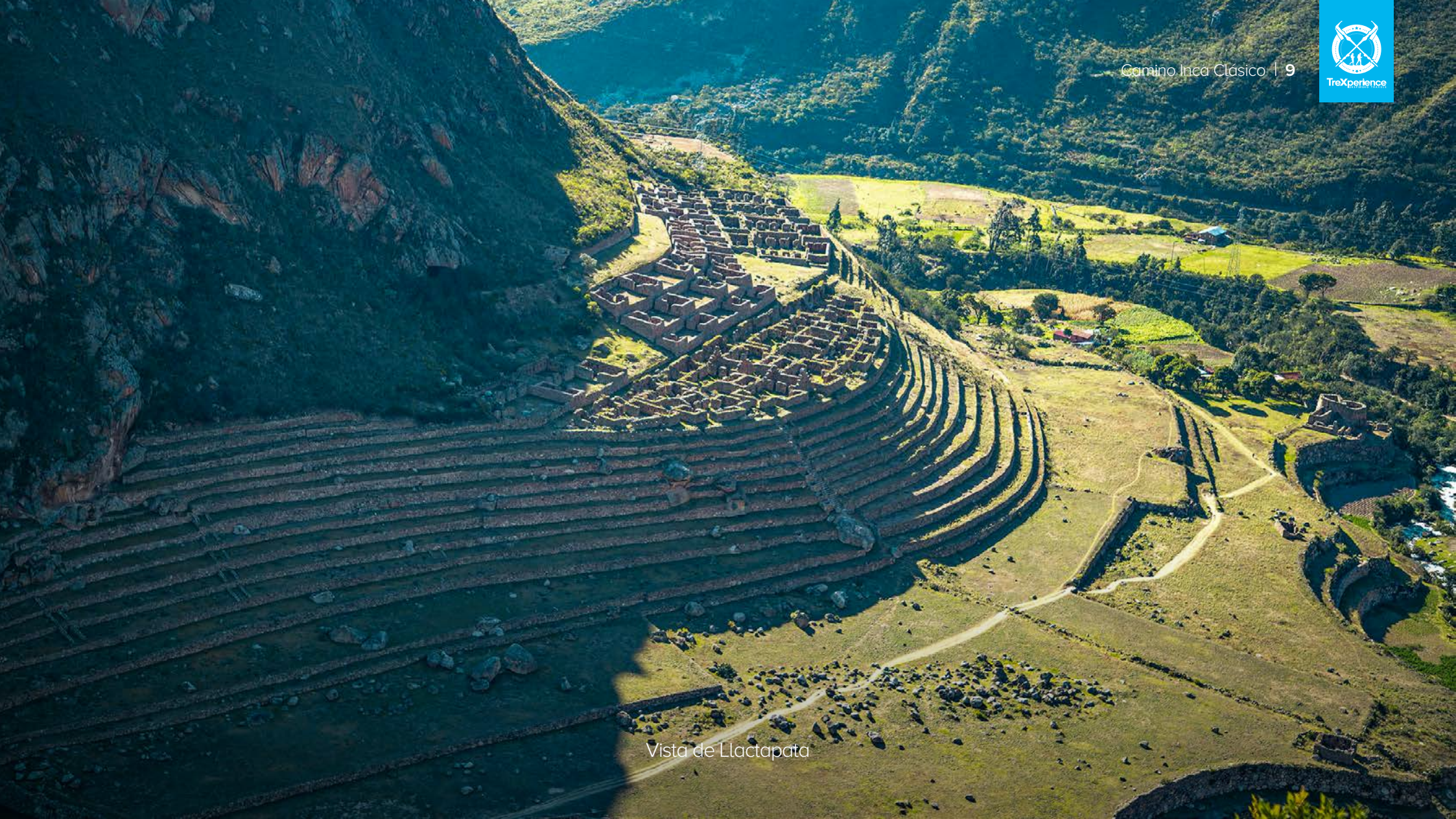
Vista de Lactapata