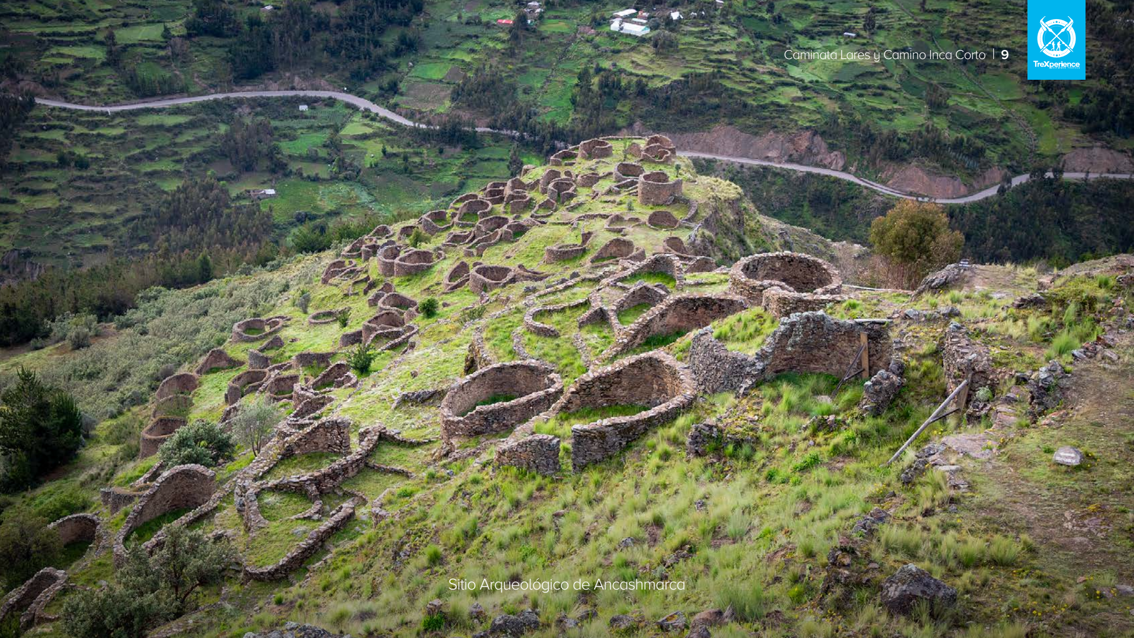
Sitio Arqueológico de Ancashmarca