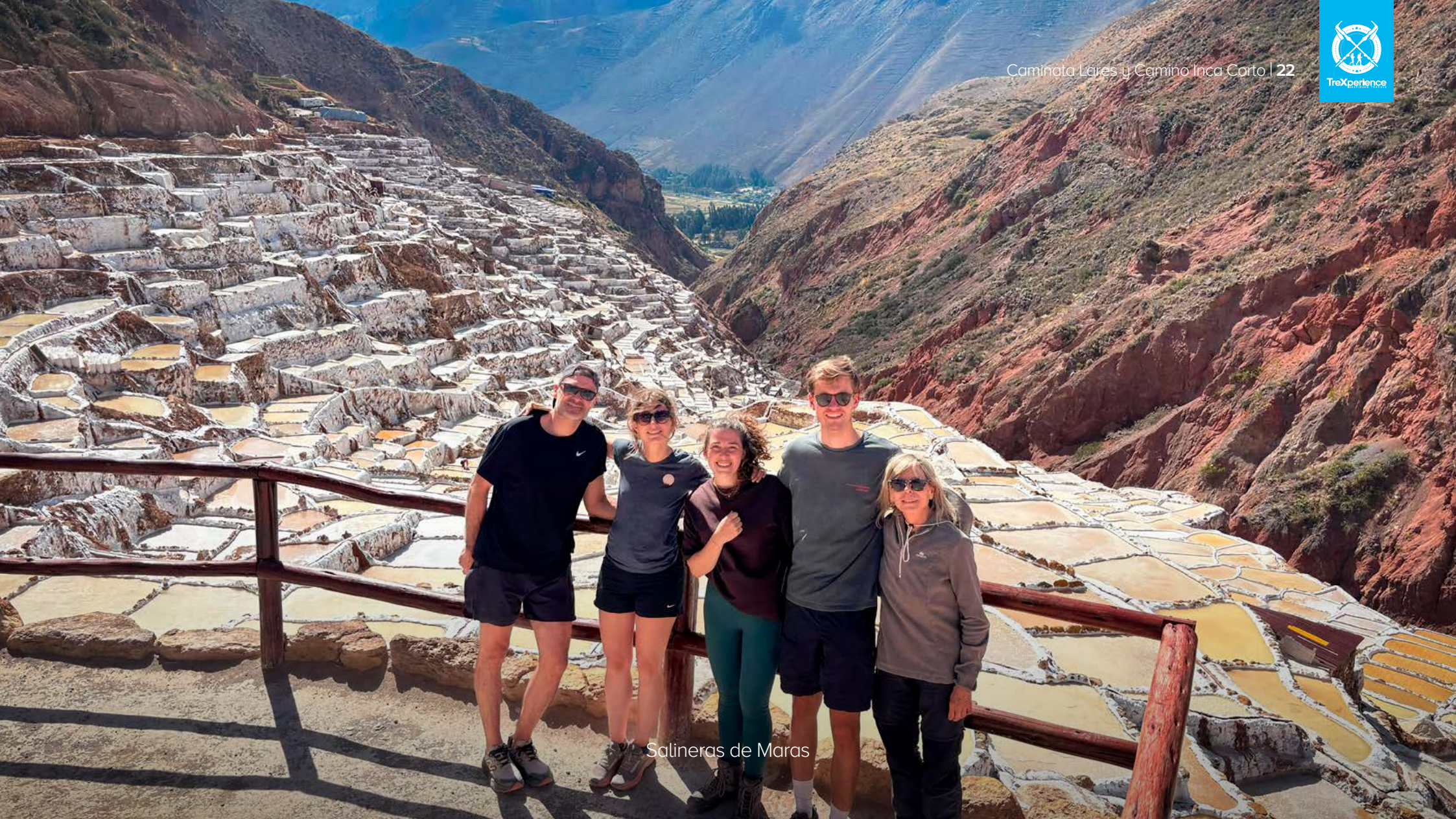
Salineras de Maras