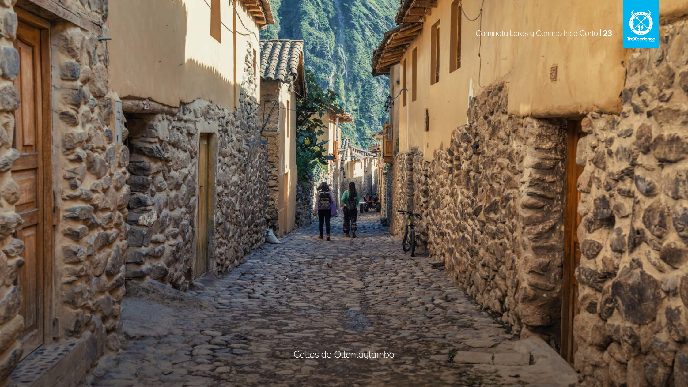
Calles de Ollantaytambo