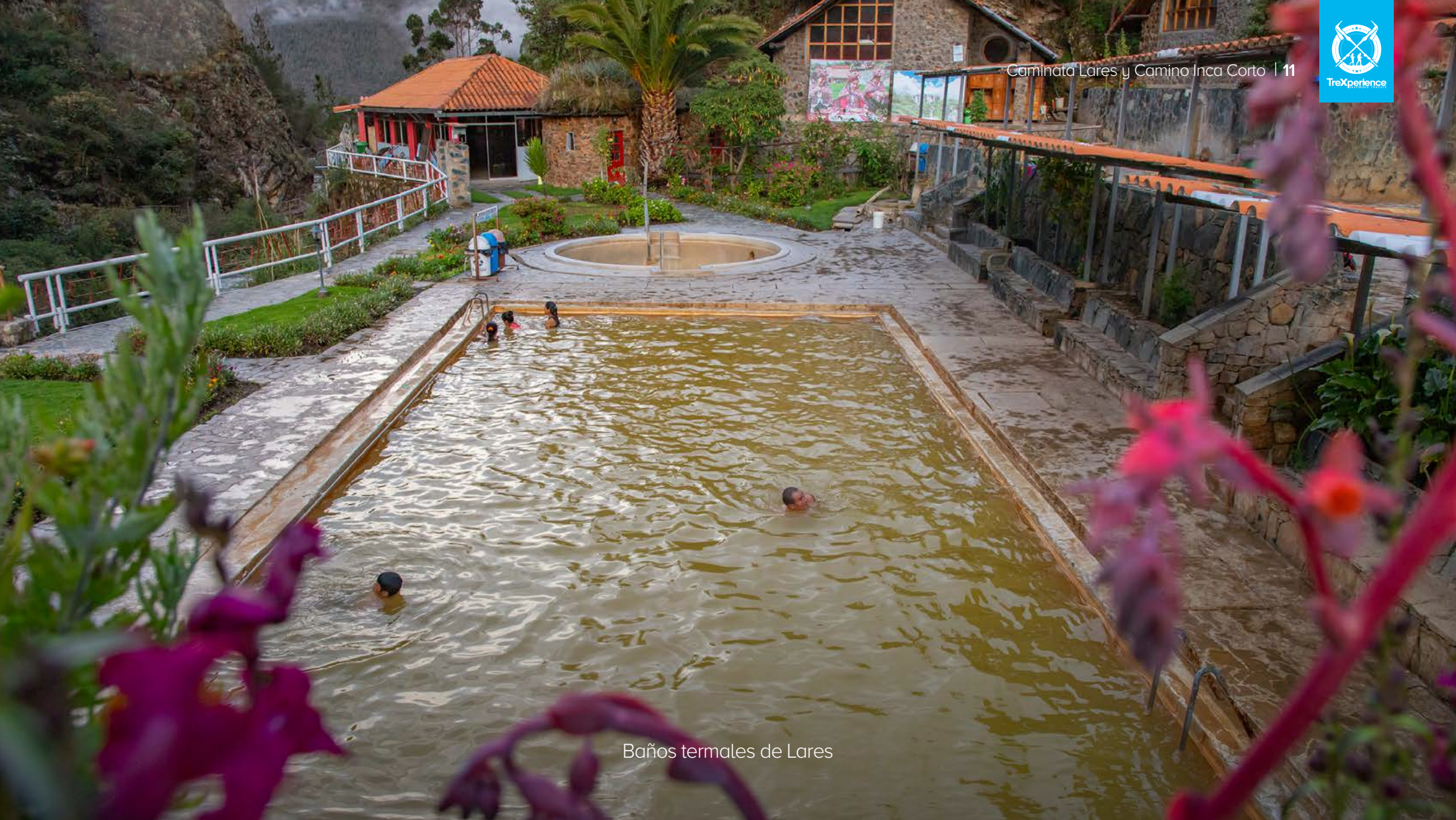
Baños termales de Lares