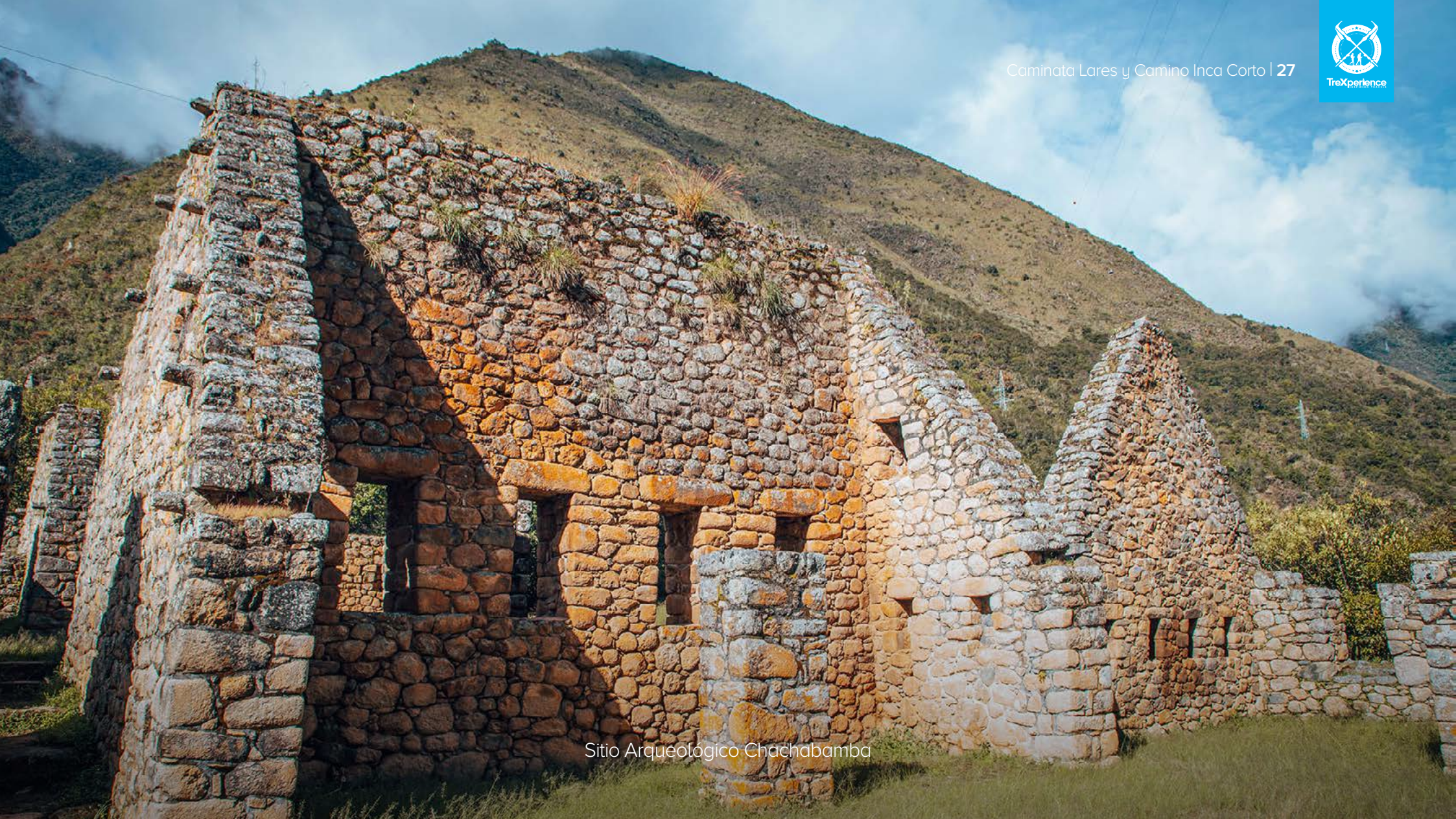
Sitio Arqueológico Chachabamba