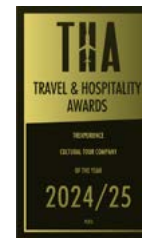
Travel & Hospitality Awards 2022