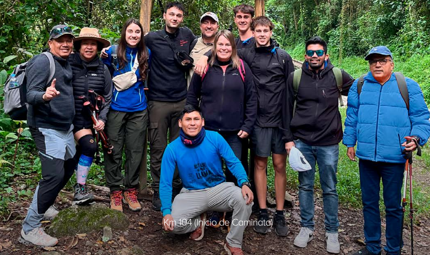
Km 104 (Inicio de Caminata)