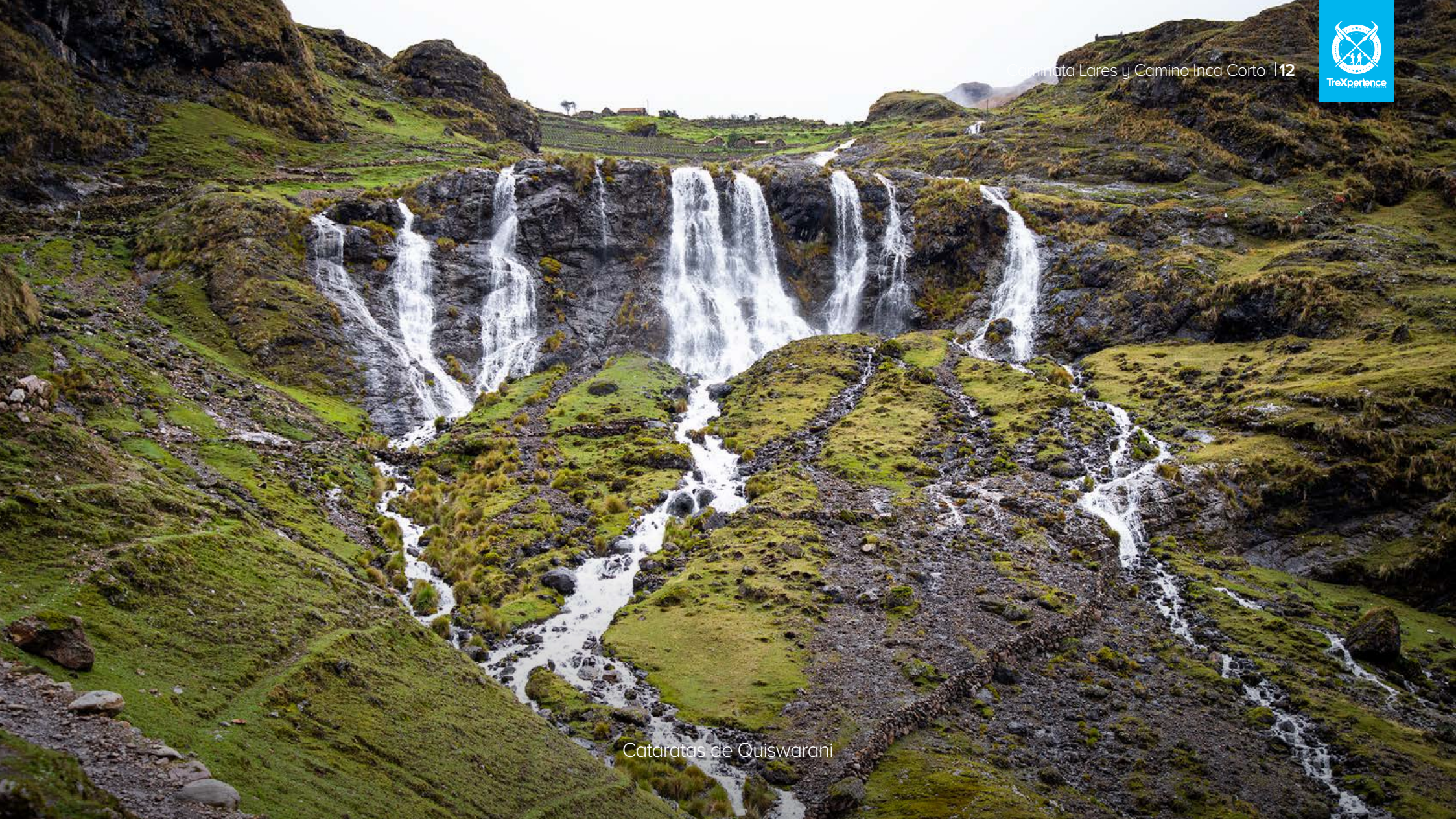
Cataratas de Quiswarani