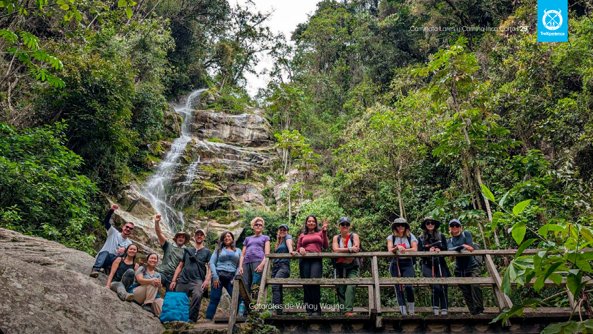
Cataratas de Wiñay Wayna