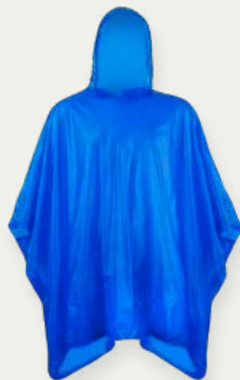
Poncho de lluvia

Durante el trek, nos ocupamos de tu comodidad: Tendrás a tu disposición un poncho para la lluvia, cobertor impermeable de mochila, polo de la empresa, tanque de oxígeno y teléfonos satelitales para garantizar tu seguridad