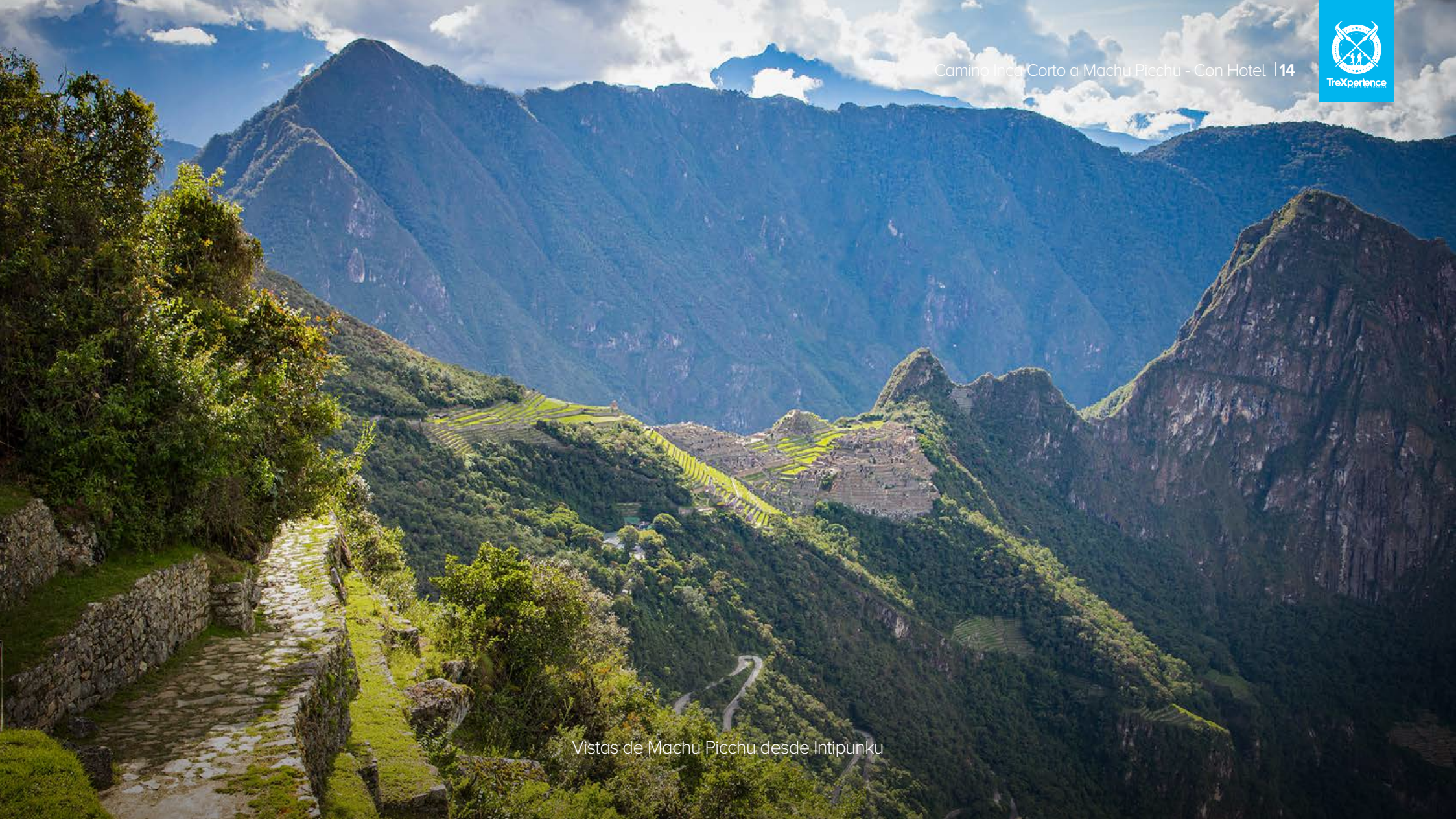
Vistas de Machu Picchu desde Intipunku