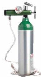
Tanque de oxígeno

Mantiene tu mochila seca bajo la lluvia.