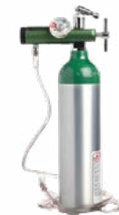
Tanque de oxígeno

Calor y comodidad en noches frías de montaña.