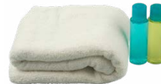
Toallas y artículos de aseo

Colchón de aire con soporte para el cuerpo.