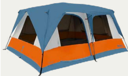
Carpa privada para dormir

Espacio cómodo para compartir las comidas.