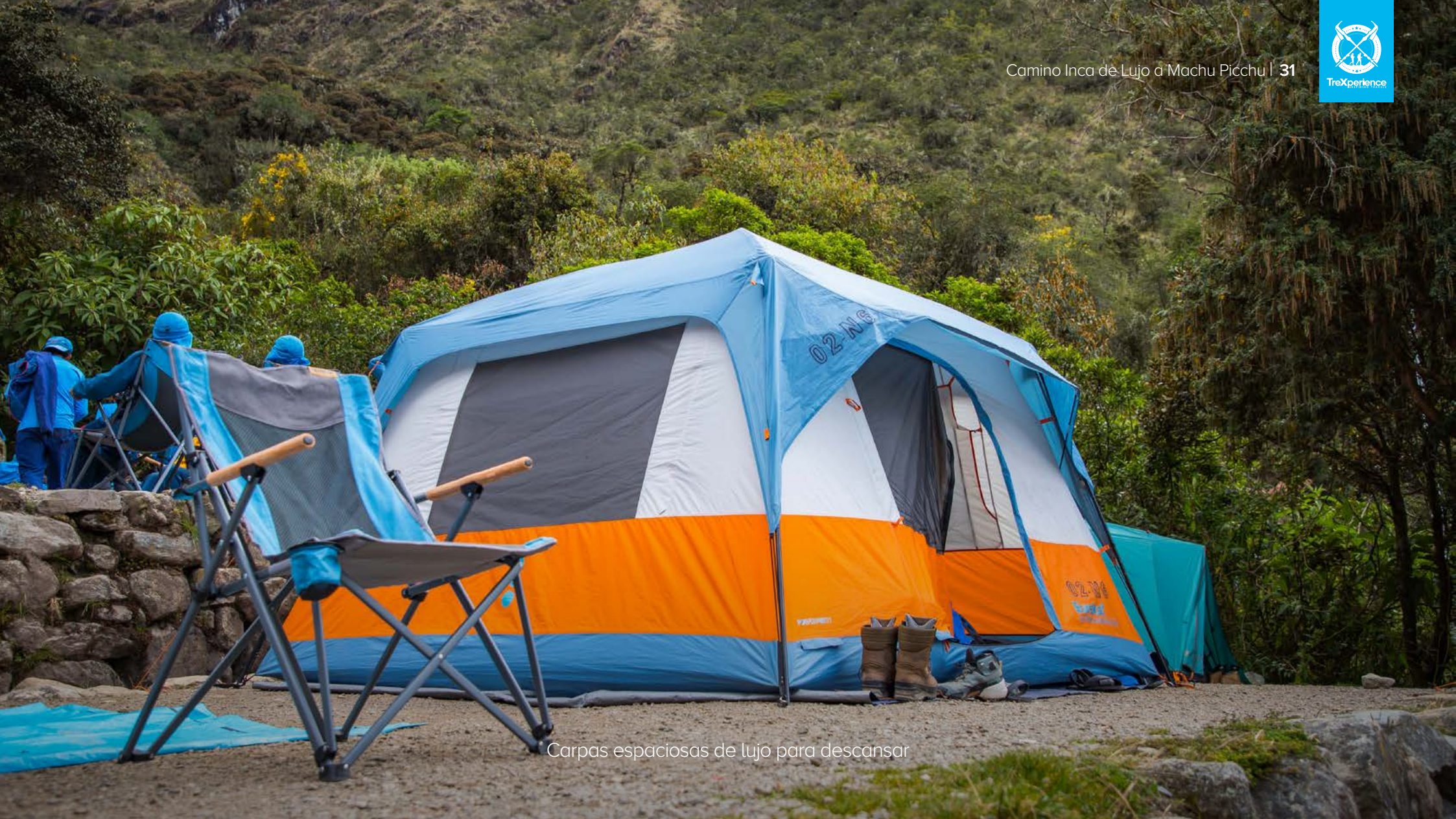
Carpas espaciaosas de lujo para descansar