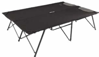
Catre de campamento

Descansa plenamente después de cada caminata con un colchón grueso, almohadas suaves, sábanas limpias y mantas abrigadoras, además de detalles pensados para que estés cómodo y renovado para mañana.